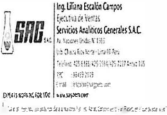
image002.jpg 18 KB

"La mejor herencia que podemos darle a nuestros hijos es: Amor, Conocimiento y un Planeta en el que puedan vivir."