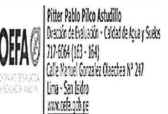
image003.gif 8 KB