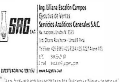
image005.jpg 18 KB