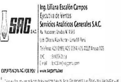
image004.jpg 18 KB