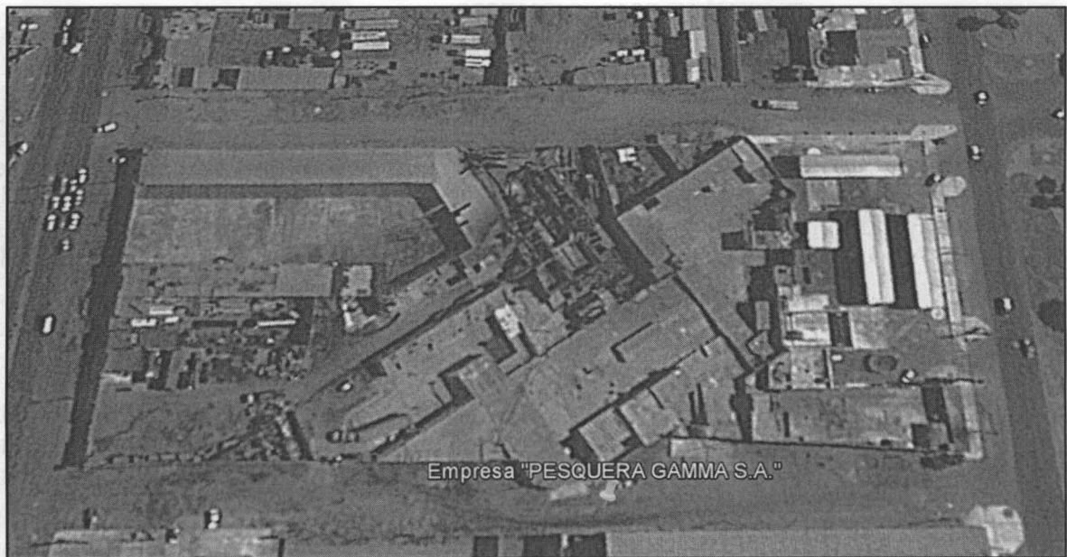
Figura N° 1. Ubicación de la Empresa "PESQUERA GAMMA S.A."

La empresa "PESQUERA GAMMA S.A.", se encuentra ubicada en el distrito de Chimbote, provincia del Santa, departamento de Ancash.