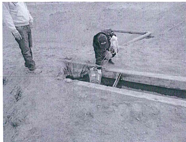
Fotografía 2. Punto de muestreo E-2, efluente que descarga a laguna facultativa. Del establecimiento industrial pesquero de la empresa acuícola Cultimarine S.A.C.