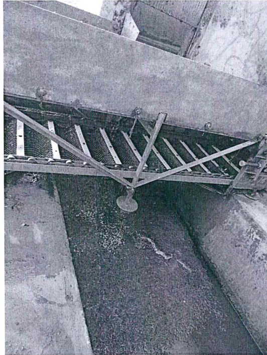
Fotografía 1. Punto de muestreo E-1, aguas residuales industriales, costado de la transportadora de sólidos, procedente del lavado de las linternas (lanterns), establecimiento industrial pesquero de la empresa acuícola Cultimarine S.A.C.