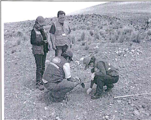
Fotografía 1. Punto de muestreo M1-SU (SL-01)- Santa Lucía – Lampa – Puno.