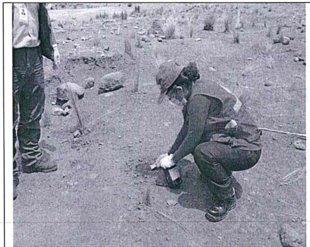
Fotografía 3. Punto de muestreo M3-SU (SL-03)- Santa Lucía – Lampa – Puno.