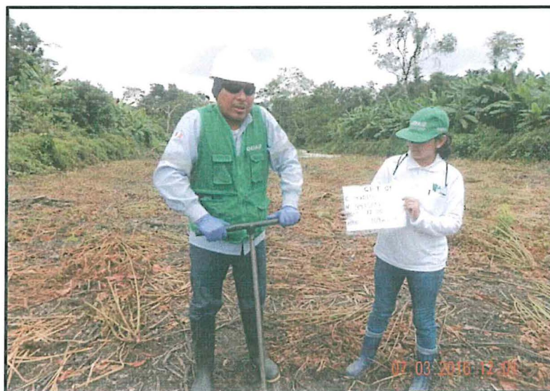
Fotografía N° 6: