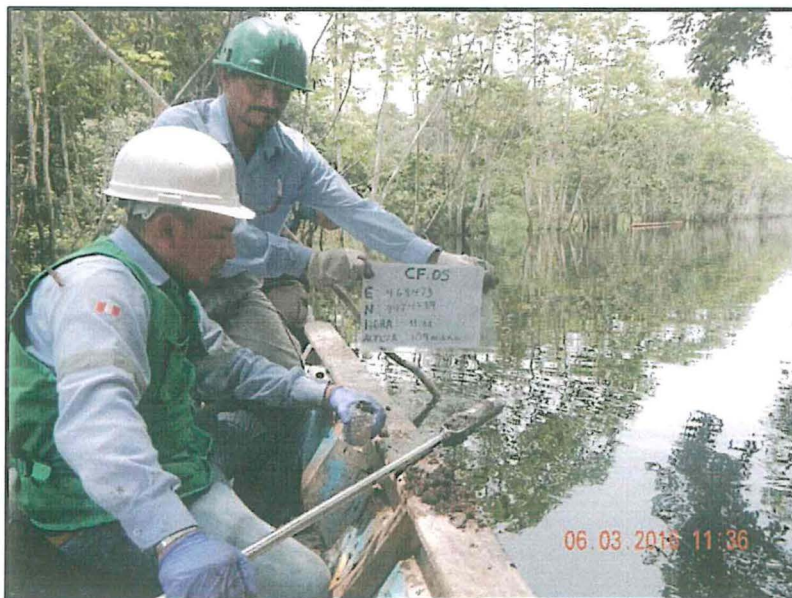
Fotografía N° 5: