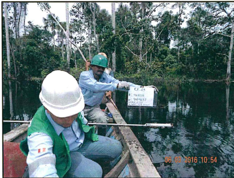
Fotografía N° 3: