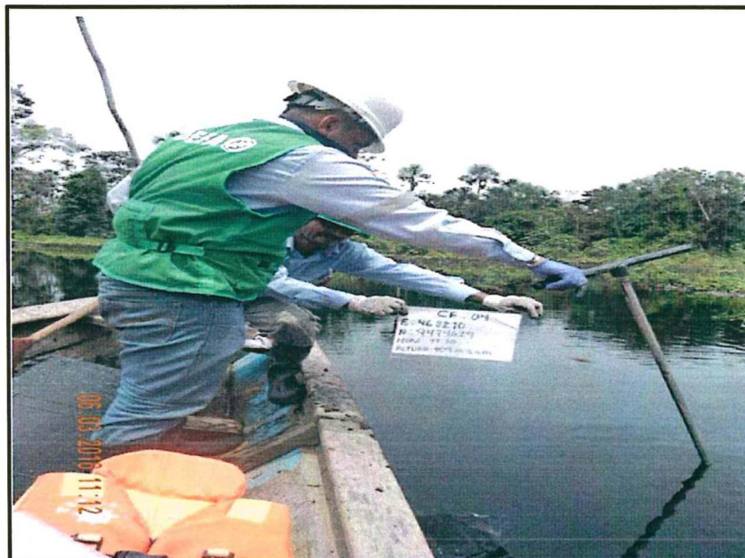
Fotografía N° 4: