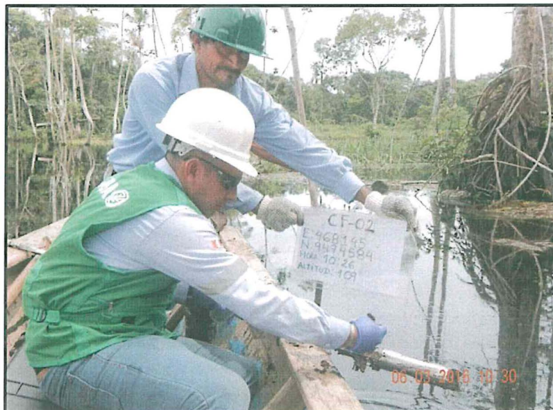
Fotografía N° 2: