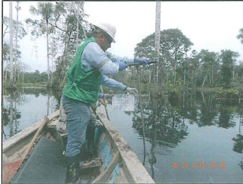
Fotografía N° 1: