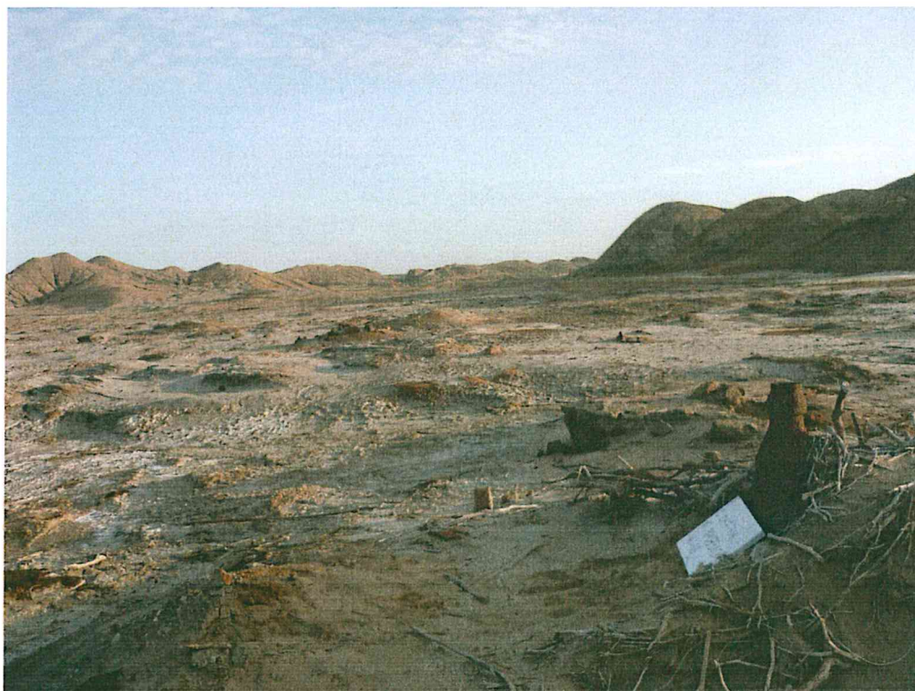
Fotografía N° 2. Área circundante al pozo mal abandonado, zona desértica, no hay presencia de población ni viviendas asentadas próximas a la ubicación del pozo.