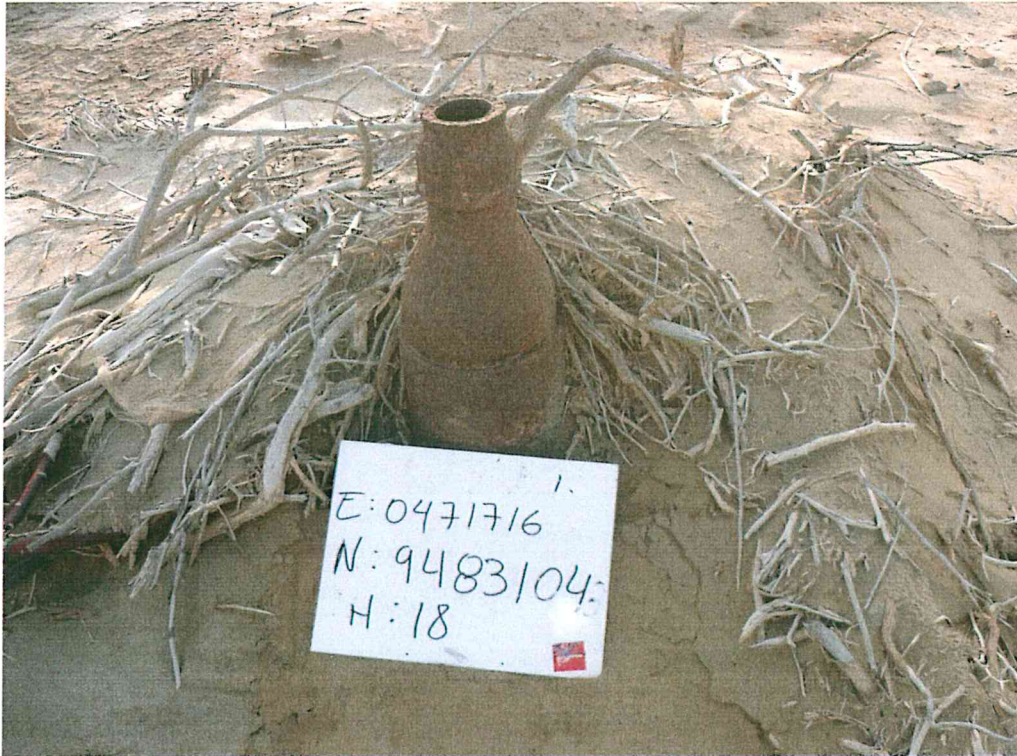
Fotografía N° 1. Pozo mal abandonado con código PERUPETRO T1257, se observa extensión de tubo cortado.

"Año de la Inversión para el Desarrollo Rural y la Seguridad Alimentaria" "Decenio de las Personas con Discapacidad en el Perú"