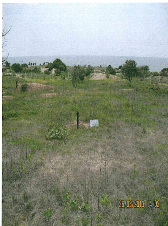
Fotografía N° 2. Vista del pozo y su entorno. No se observó suelo impregnado con hidrocarburo ni afloramiento de fluidos, tampoco se percibieron olores característicos a hidrocarburos.