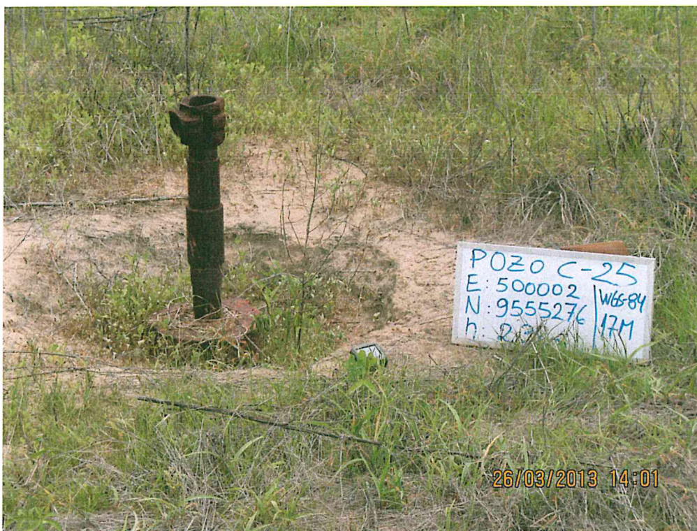
Fotografía N° 1. Pozo inactivo, se observa el casing con tubería que sobresale 0,5 m sobre el nivel del suelo.

"Año de la Inversión para el Desarrollo Rural y la Seguridad Alimentaria" "Decenio de las Personas con Discapacidad en el Perú"