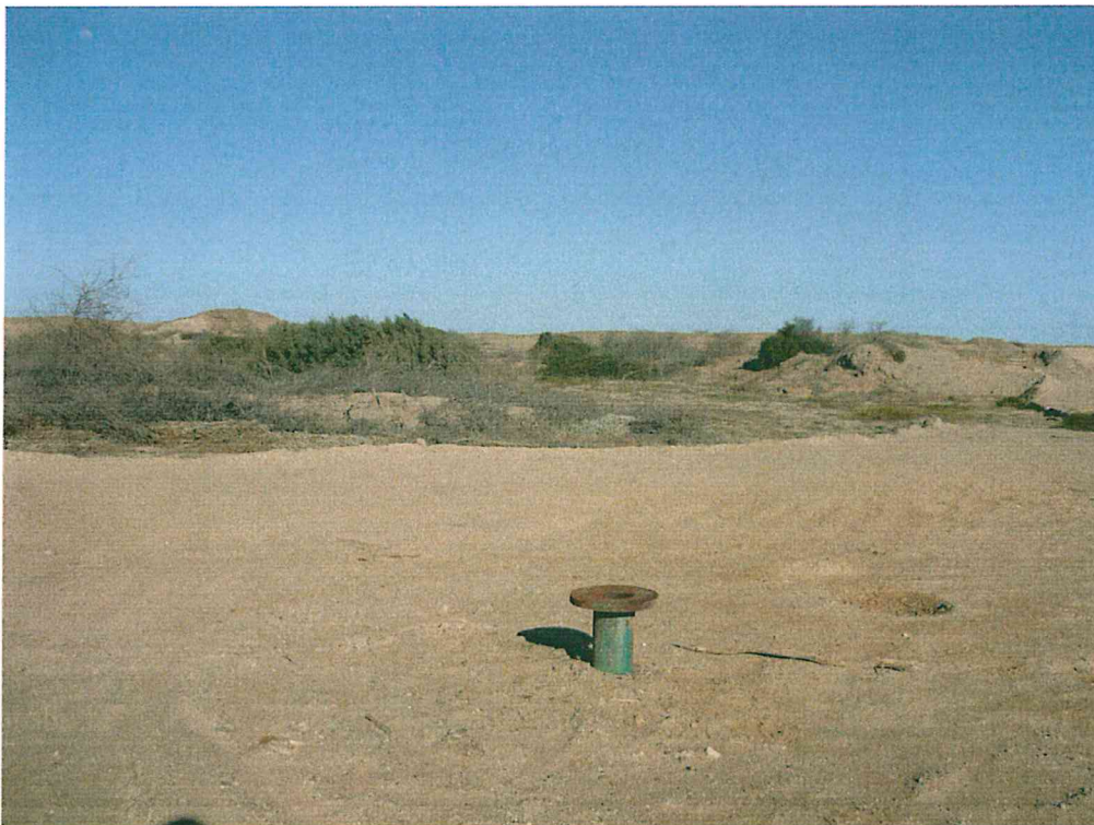
Fotografía N° 2. Vista panorámica de la ubicación del pozo mal abandonado.