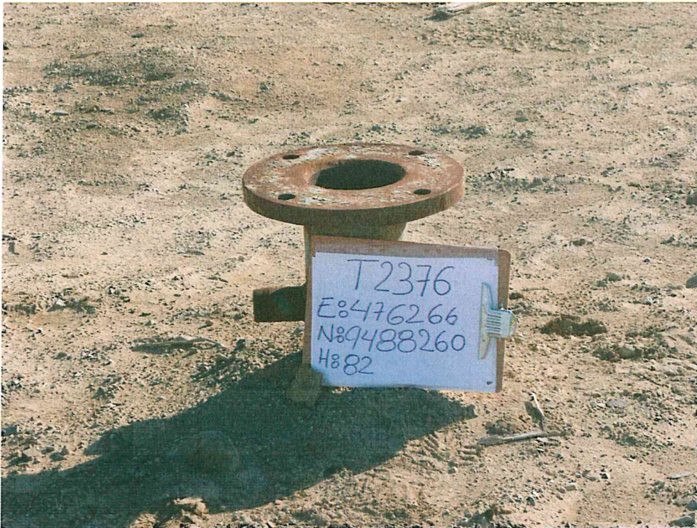
Fotografía N° 1. Pozo T2376 mal abandonado, en área acondicionada de relieve plano.

"Año de la Inversión para el Desarrollo Rural y la Seguridad Alimentaria" "Decenio de las Personas con Discapacidad en el Perú"