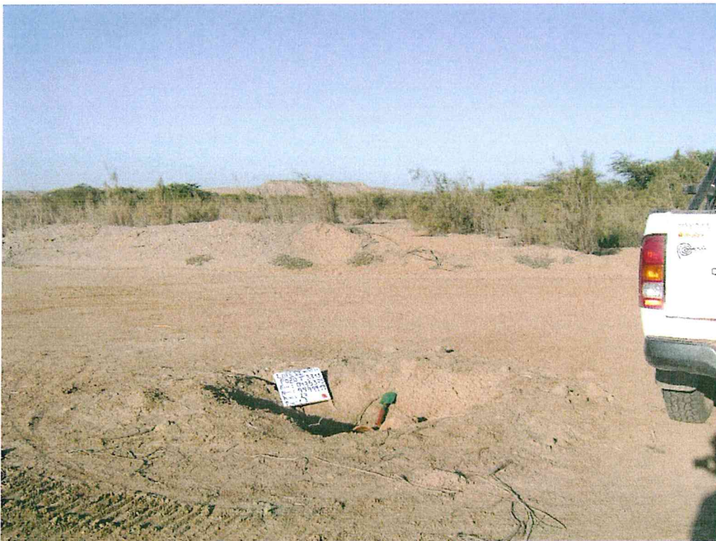
Fotografía N° 2. Pozo mal abandonado cercano a zona de pastoreo.