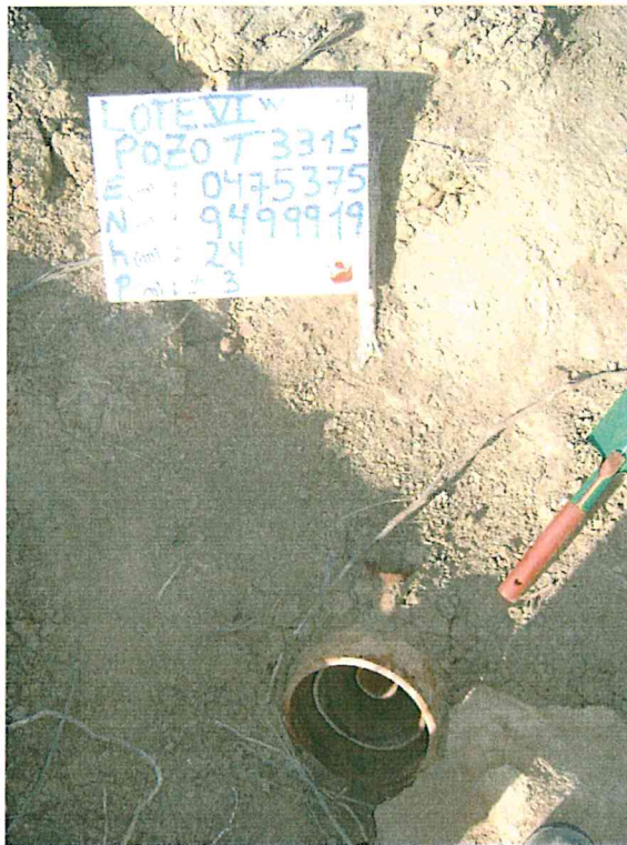
Fotografía N° 1. Se observa pozo mal abandonado, con tuberías de revestimiento expuestas y sin tapón.

"Año de la Inversión para el Desarrollo Rural y la Seguridad Alimentaria" "Decenio de las Personas con Discapacidad en el Perú"