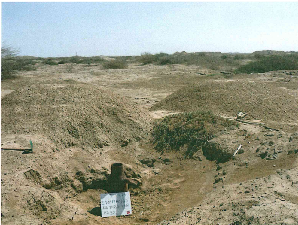
Fotografía N° 2. Área evaluada caracterizada por su relieve llano y árido, de escasa vegetación, entre las que se distinguen el faique y el vichayo.