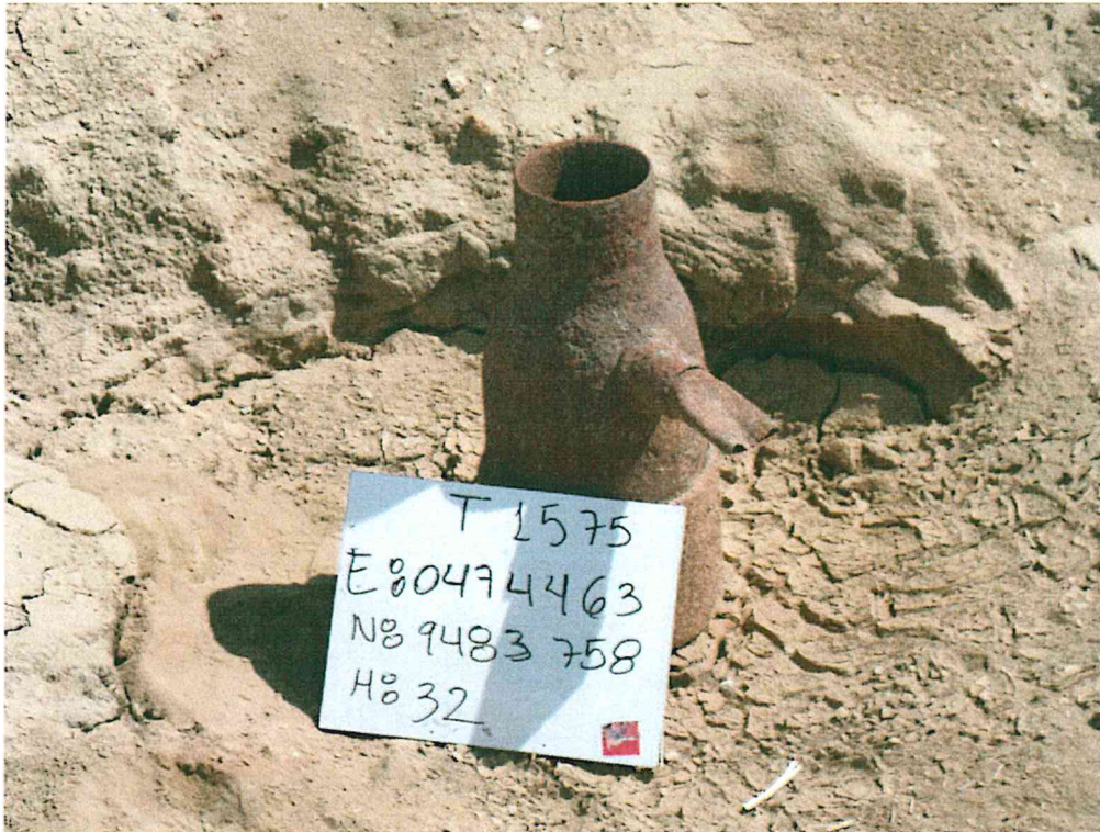
Fotografía N° 1. Pozo inactivo mal abandonado, con extensión de tubo deteriorado y corroído de 6 pulgadas de diámetro, que sobresale 0,61 m sobre el nivel del terreno.

"Año de la Promoción de la Industria Responsable y del Compromiso Climático" "Decenio de las Personas con Discapacidad en el Perú"