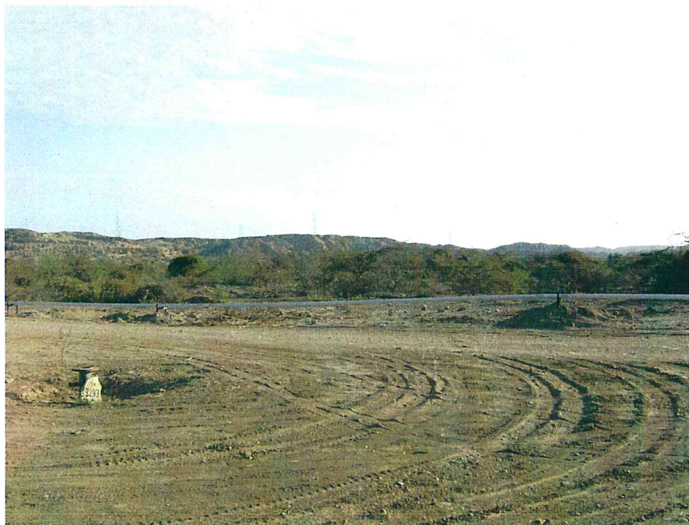
Fotografía N° 2. Se evidencia la cercanía del pozo a la línea de gas.