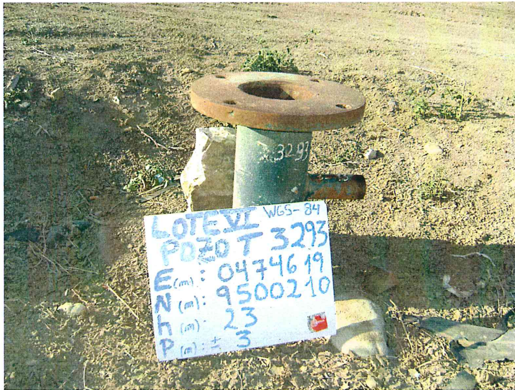
Fotografía N° 1. Se observa pozo mal abandonado con casing sin tapón y expuesto al aire libre.

"Año de la Promoción de la Industria Responsable y del Compromiso Climático" "Decenio de las Personas con Discapacidad en el Perú"