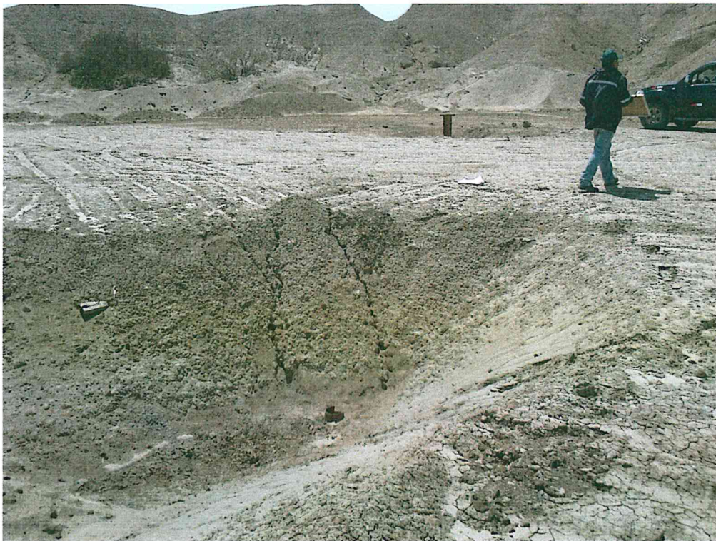
Fotografía N° 2. Pozo inactivo, se observa el casing, sin cabezal ni válvulas, a 1,60 m aproximadamente por debajo del nivel del terraplén.