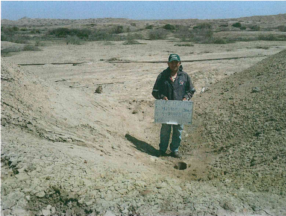
Fotografía N° 1. Zona evaluada donde se ubica el pozo, se caracteriza por tener una topografía ligeramente ondulada y de suave pendiente, con escasa vegetación y escasa red de drenaje.