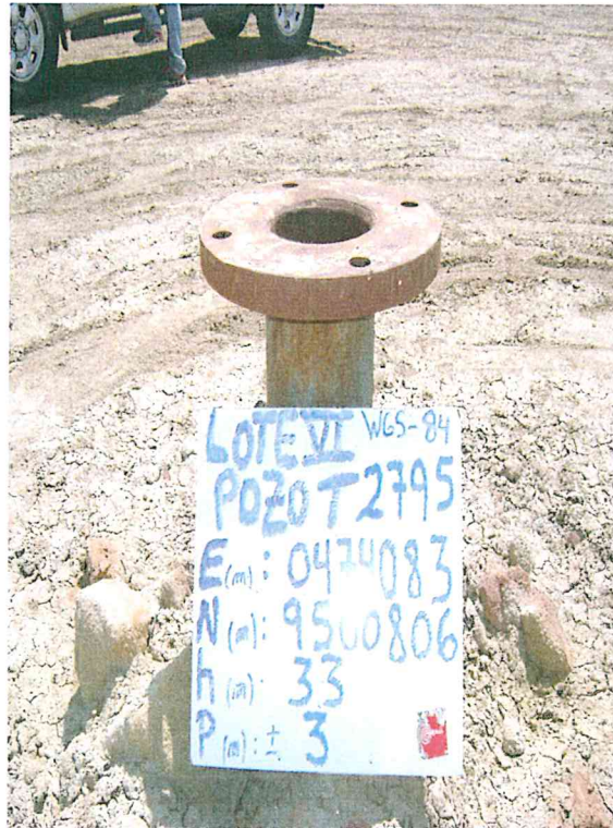
Fotografía N° 1. Se observa pozo mal abandonado, con casing sin tapón y expuesto al aire libre.

"Decenio de las Personas con Discapacidad en el Perú" "Año de la Promoción de la Industria Responsable y del Compromiso Climático"