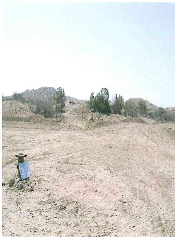
Fotografía N° 2. Área circundante al pozo mal abandonado.