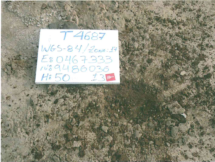
Fotografía N° 3. Se visualizó suelos con diferencias de color y textura, presencia de residuos de hidrocarburo impregnados en el suelo.

"Decenio de las Personas con Discapacidad en el Perú" "Año de la Promoción de la Industria Responsable y del Compromiso Climático"