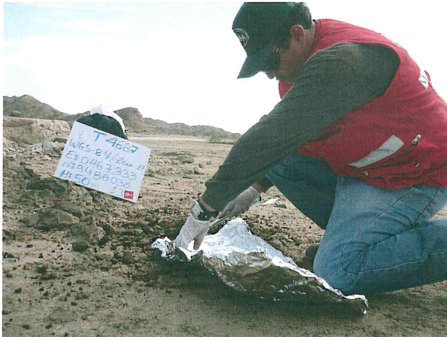
Fotografía N° 4. Presencia de residuos de hidrocarburo impregnados en el suelo, se realizó la toma de una muestra para su análisis.