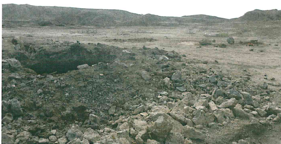
Fotografía N° 2. Vista panorámica del área evaluada, de relieve plano con presencia de pequeñas lomas, de nula vegetación.