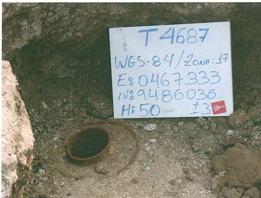
Fotografía N° 1. Pozo inactivo mal abandonado, sin cabezal, con casing (tubería de revestimiento) cementado y tubo interior corroído, a nivel del suelo.