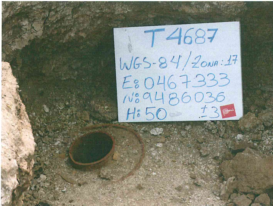
Fotografía N° 1. Pozo inactivo mal abandonado, sin cabezal, con casing (tubería de revestimiento) cementado y tubo interior corroído, a nivel del suelo.