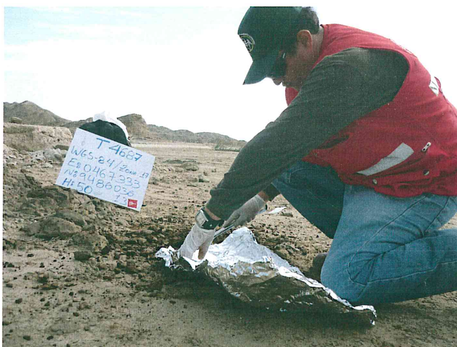
Fotografía N° 4. Presencia de residuos de hidrocarburo impregnados en el suelo, se realizó la toma de una muestra para su análisis.