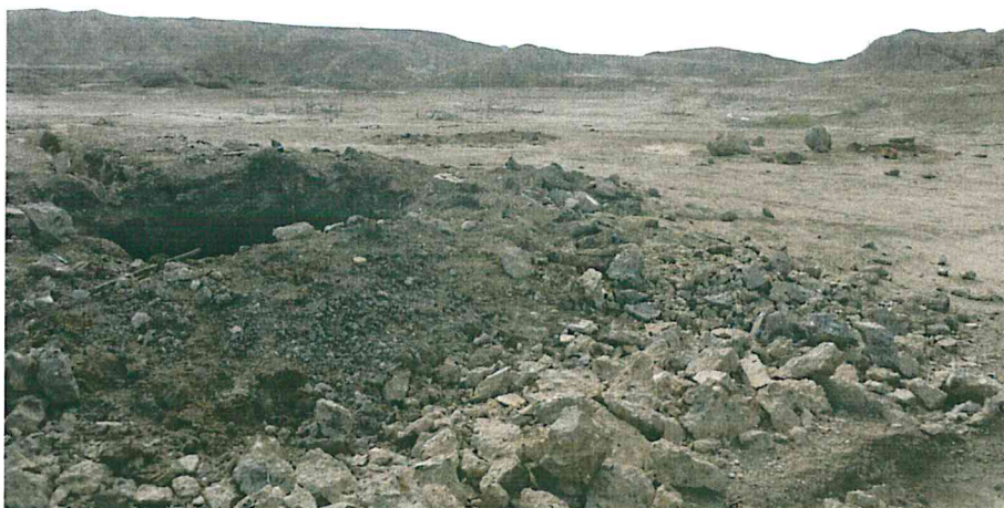
Fotografía N° 2. Vista panorámica del área evaluada, de relieve plano con presencia de pequeñas lomas, de nula vegetación.