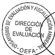
DELIA MORALES CUTI Directora de Evaluación (e)

San Isidro, De conformidad con el Informe que antecede y estando de acuerdo con su contenido APRUÉBESE el INFORME N° -2014-OEFA/DE-SDCA.