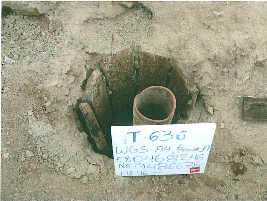
Fotografía N° 1. Pozo inactivo, sin cabezal, no preseta casing de revestimiento, en su lugar se observa tablones de madera y tubo interior corroído.