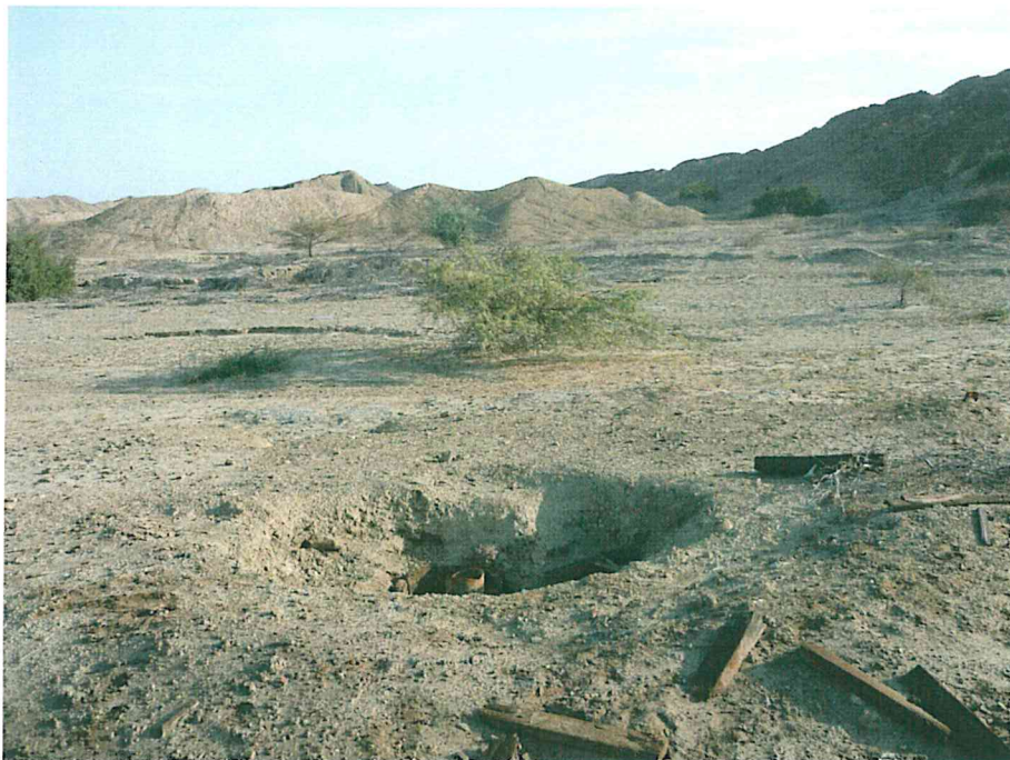
Fotografía N° 2. Área evaluada de paisaje dominante caracterizado por planicies o tablazos, con algunas zonas ligeramente onduladas.