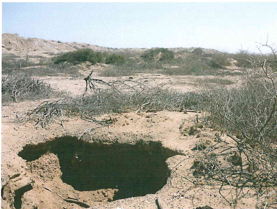
Fotografía N° 2. Zona evaluada de relieve llano y árido, con algunas geofomas que inciden sobre el relieve del área como lomas, colinas y superficies depresionadas.