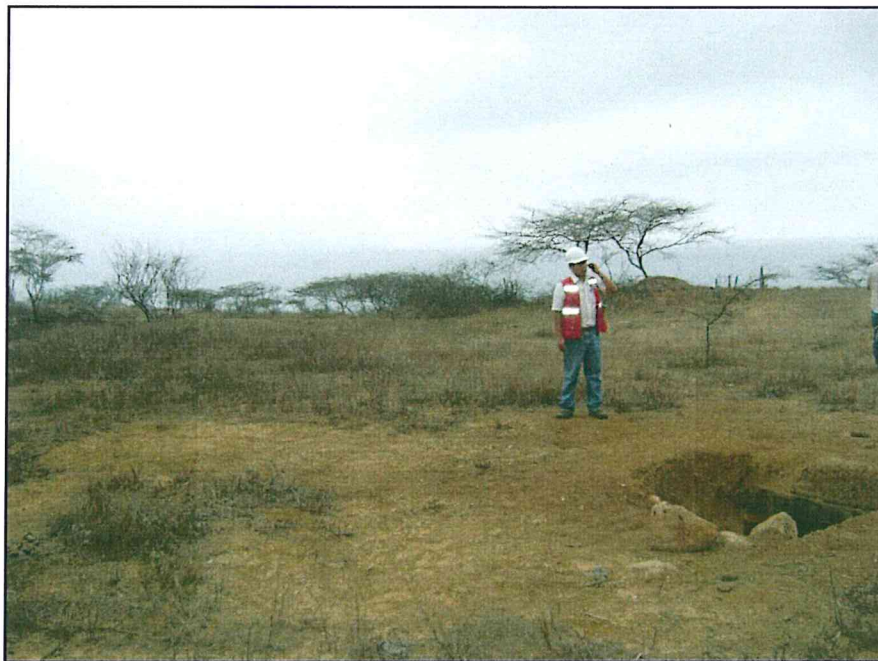
Fotografía N° 2. Se evidencia un forado en la zona del pozo.