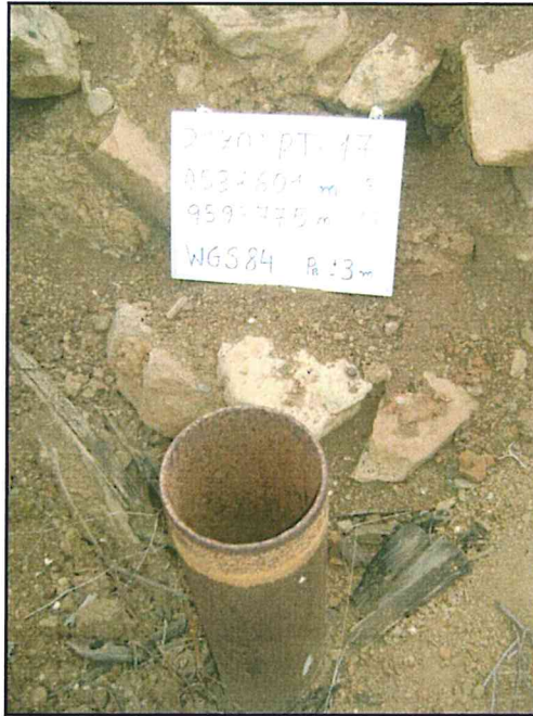
Fotografía N° 1. Pozo inactivo abierto y sin señalización.

"Decenio de las Personas con Discapacidad en el Perú" "Año de la Promoción de la Industria Responsable y del Compromiso Climático"