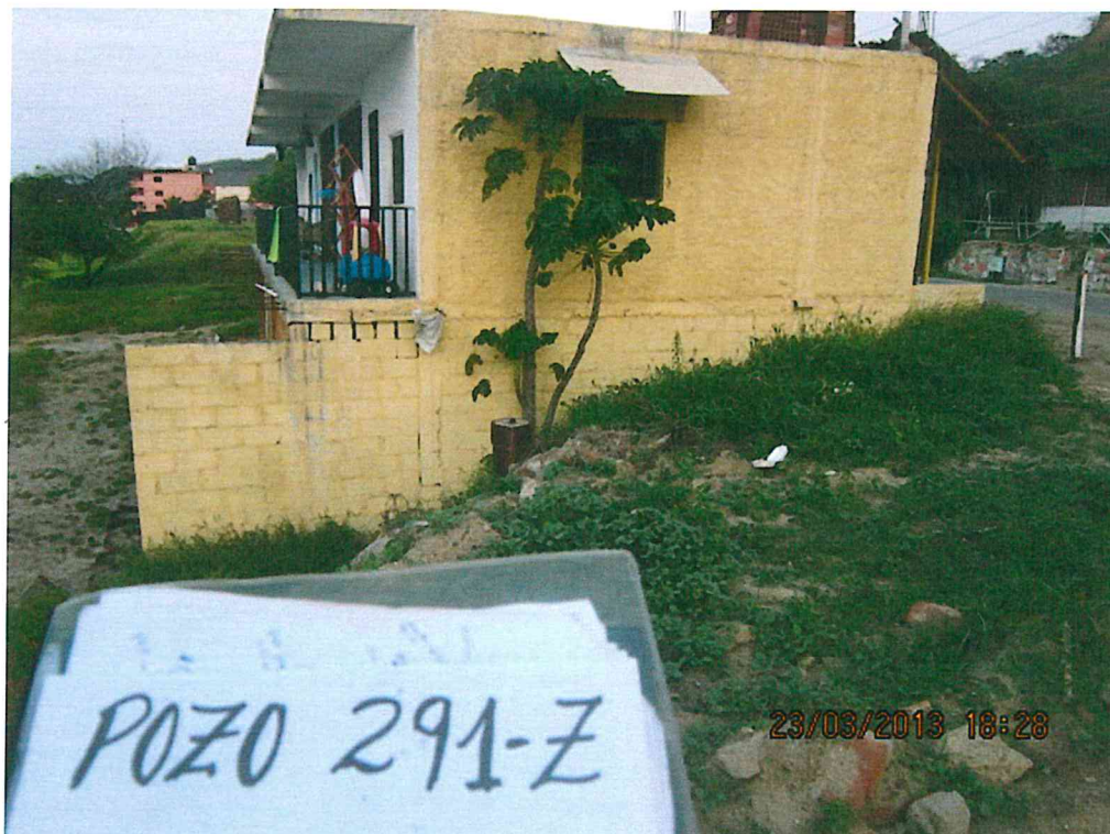
Fotografía N° 2. El pozo se encuentra al lado de una vivienda y 30 m de la playa.