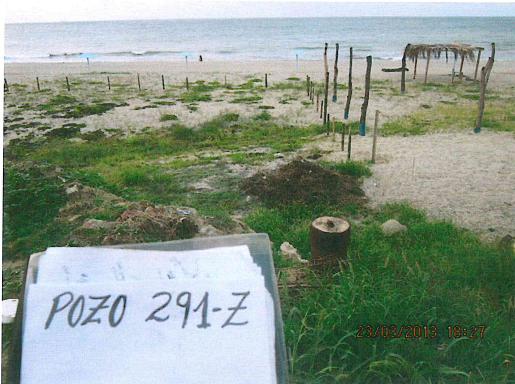
Fotografía N° 1. Pozo inactivo sin cabezal, con casing corroído y cementado en su interior, no se aprecia afloramiento de fluido ni suelo impregnado con hidrocarburo.

"Decenio de las Personas con Discapacidad en el Perú" "Año de la Promoción de la Industria Responsable y del Compromiso Climático"