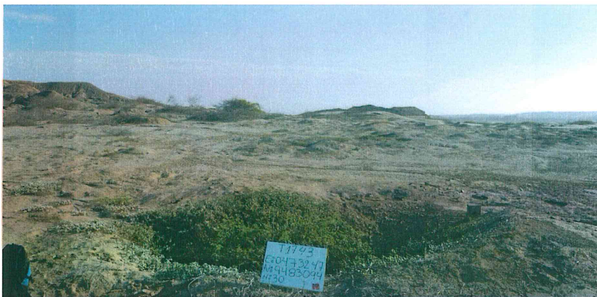
Fotografía N° 2. Zona evaluada caracterizada por su relieve llano y árido, con amplios sectores cubiertos por un manto de arenas eólicas.