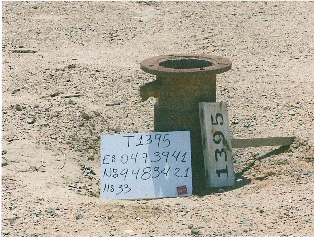
Fotografía N° 1. Pozo inactivo, sin cabezal, con extensión de tubo y brida corroído, que sobresale 0,88 m sobre el nivel del terreno.

"Decenio de las Personas con Discapacidad en el Perú" "Año de la Promoción de la Industria Responsable y del Compromiso Climático"