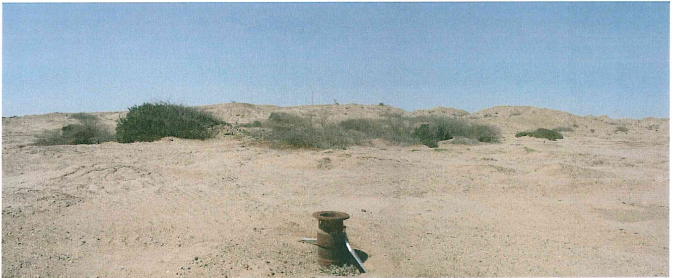
Fotografía N° 2. Zona evaluada de relieve llano y árido, con presencia de lomas, colinas y superficies depresionadas, de escasa vegetación.