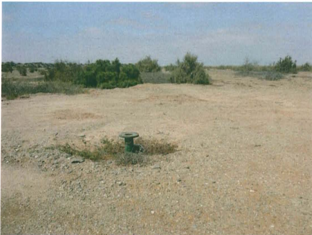
Fotografía N° 2. Vista panorámica del Pozo T4044, en zona habilitada tipo terraplén, se observa la presencia de vegetación circundante al pozo.