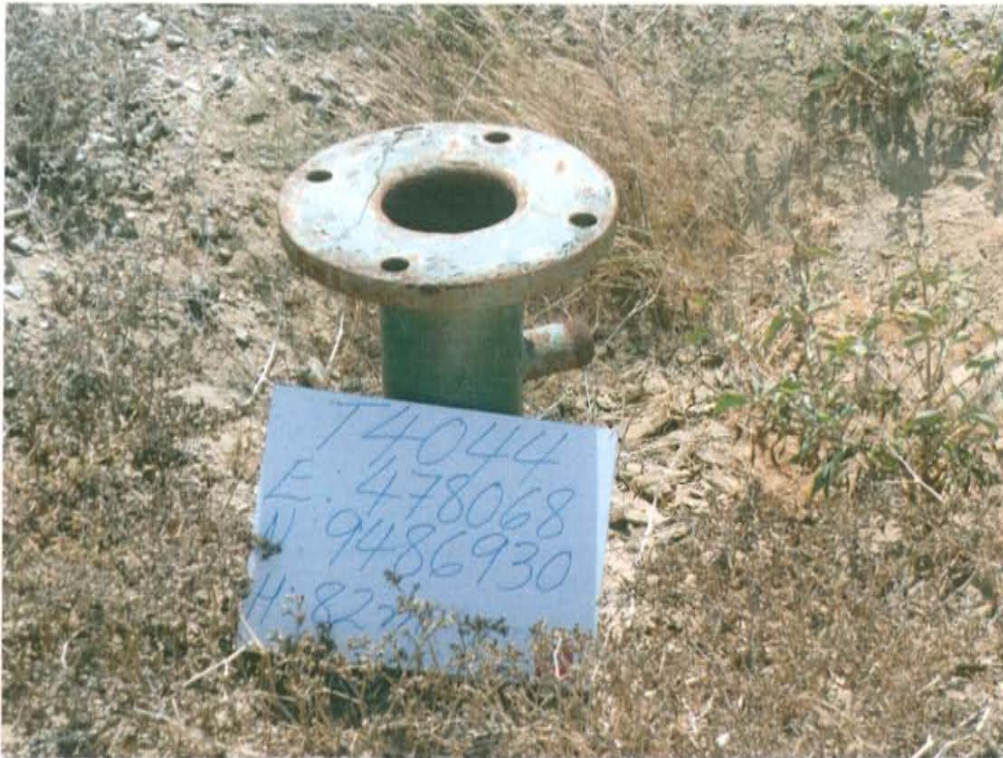
Fotografía N° 1. Pozo mal abandonado con código PERUPETRO T4044, con extensión de tubo y brida corroidos, no sellado herméticamente.