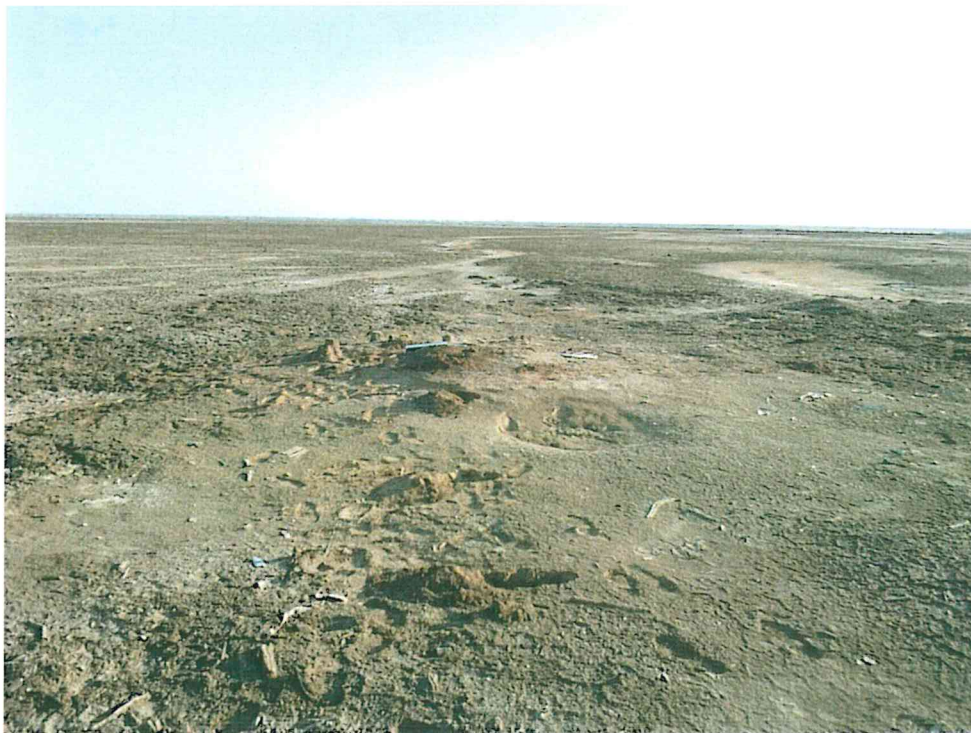
Fotografía N° 4. Vista panorámica (lateral) de los alrededores del pozo con suelo impregnado con hidrocarburos.