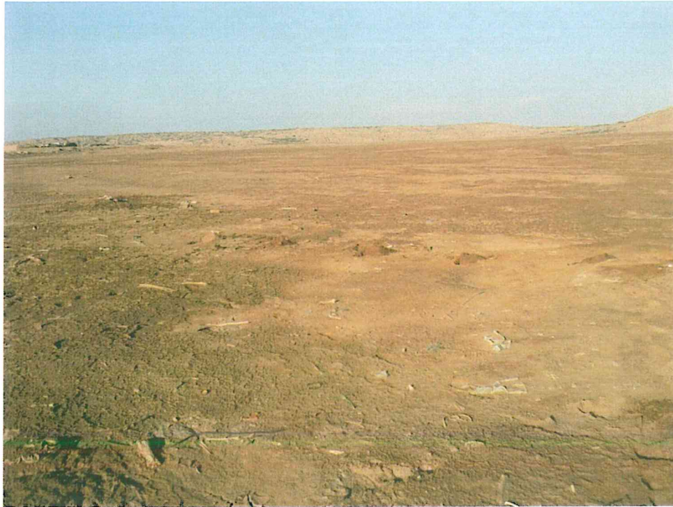
Fotografía N° 3. Vista panorámica de los alrededores del pozo con suelo impregnado con hidrocarburos.