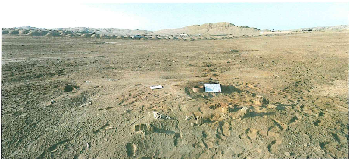
Fotografía N° 2. Vista panorámica de los alrededores al pozo T1412, se observa suelo arenoso de escasa vegetación con topografía plana.