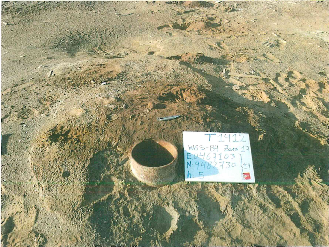
Fotografía N° 1. Vista del pozo T1412, no cuenta con cabezal o válvula alguna por lo que se considera abierto.