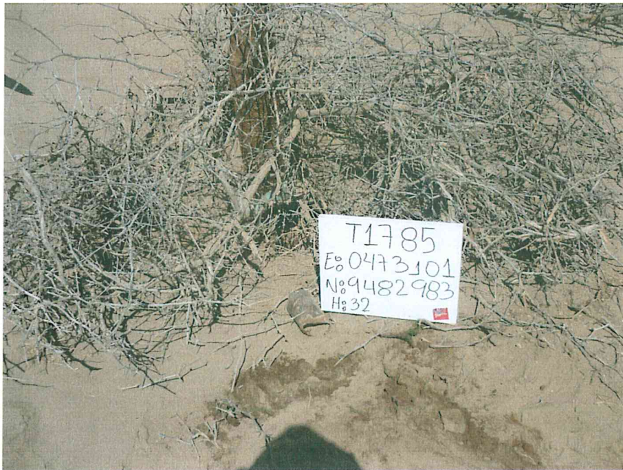
Fotografía N° 1. Pozo inactivo mal abandonado, sin cabezal, con casing corroído a nivel del suelo, cubierto de vegetación seca.

"Decenio de las Personas con Discapacidad en el Perú" "Año de la Promoción de la Industria Responsable y del Compromiso Climático"