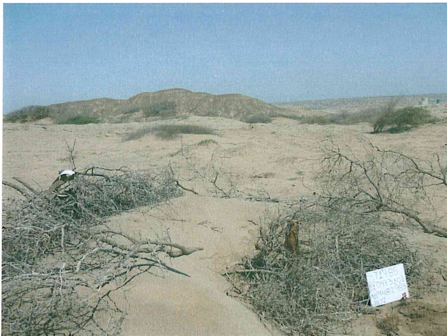
Fotografía N° 2. Zona evaluada caracterizada por su relieve llano y árido, con algunas geoformas que inciden sobre el relieve del área como lomas.