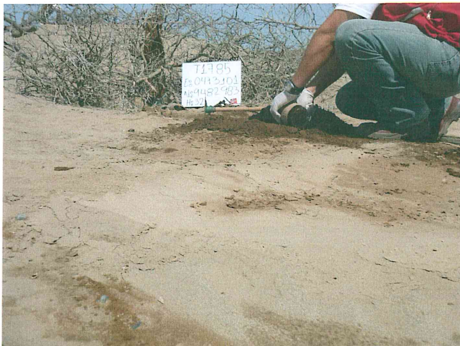
Fotografía N° 4. Recojo de muestra de suelos para su análisis.