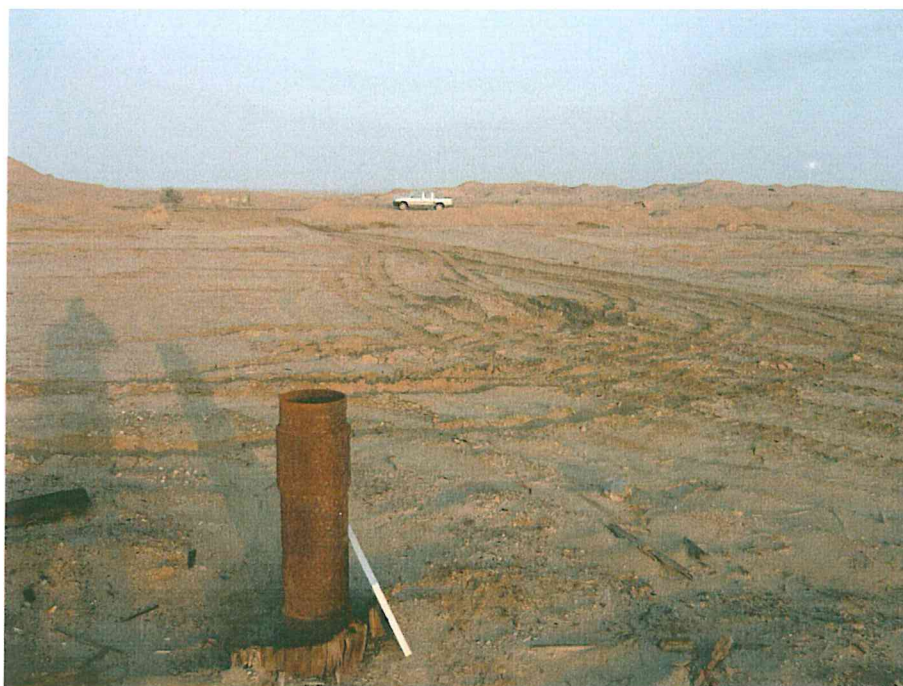
Fotografía N° 2. Área de paisaje dominante caracterizado por planicies o tablazos, con algunas zonas ligeramente onduladas como lomas y superficies depresionadas.