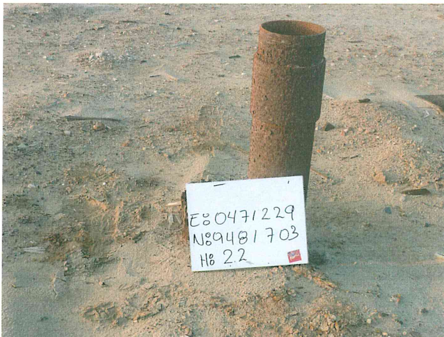
Fotografía N° 1. Pozo inactivo mal abandonado, sin cabezal, con tubo corroído que sobresale 0,60 m sobre el nivel del terreno.

"Decenio de las Personas con Discapacidad en el Perú" "Año de la Promoción de la Industria Responsable y del Compromiso Climático"