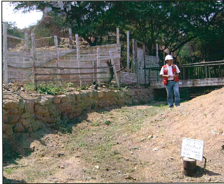
Fotografía N° 3. Vista panorámica lateral del pozo, próximo a una vivienda.

"Decenio de las Personas con Discapacidad en el Perú" "Año de la Promoción de la Industria Responsable y del Compromiso Climático"