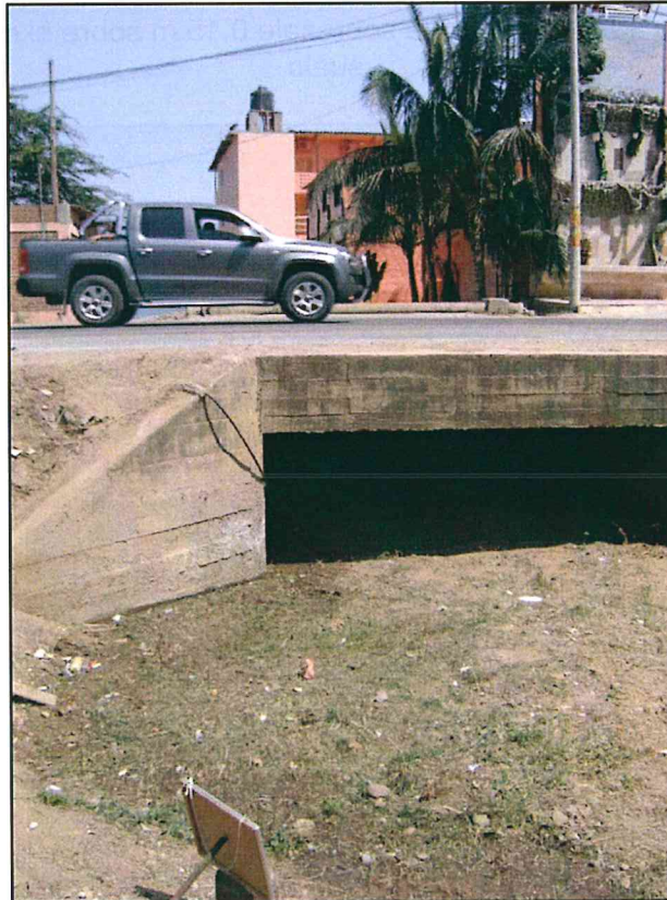
Fotografía N° 4. Vista panorámica lateral del pozo, próximo a vía asfaltada y hoteles turísticos.