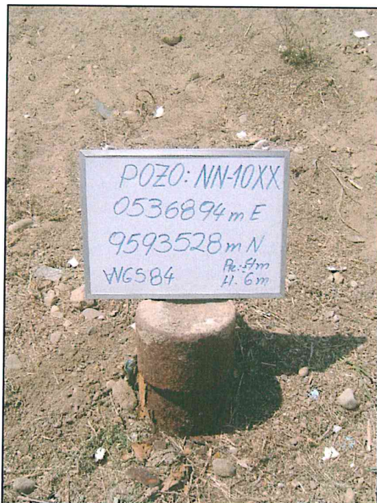
Fotografía N° 1. Pozo abandonado que sobresale 0,15 m sobre el nivel de la superficie del suelo.

"Decenio de las Personas con Discapacidad en el Perú" "Año de la Promoción de la Industria Responsable y del Compromiso Climático"