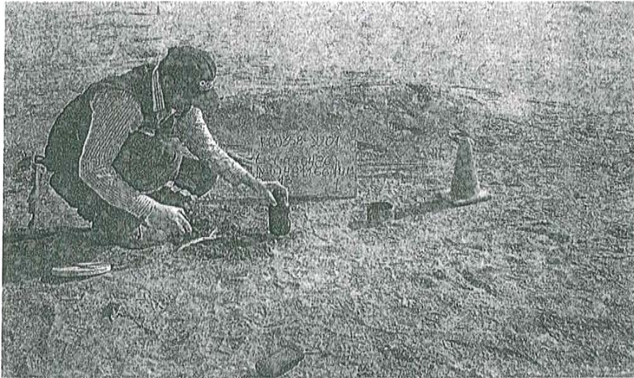
Fotografía N° 1. Toma de muestra de suelo en el punto F00358-SU01, ubicado a 0,50 m aproximadamente del Pozo T1051.

"Decenio de las Personas con Discapacidad en el Perú" "Año de la Promoción de la Industria Responsable y del Compromiso Climático"