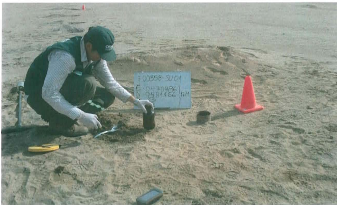
Fotografía N° 3. Recojo de muestra en el punto F00358-SU01, a 0,5 m del pozo inactivo.