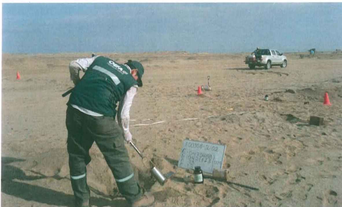
Fotografía N° 4. Ubicación del punto F00358-SU02, aproximadamente a 7 m al norte del pozo inactivo.