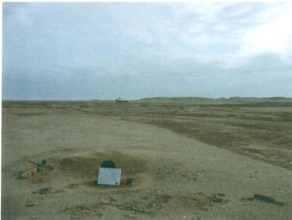
Fotografía N° 2. Vista panorámica de la ubicación del Pozo T1051, desértico, de escasa vegetación.