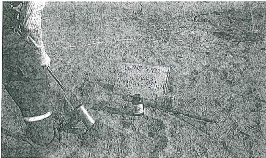
Fotografía N° 2. Toma de muestra de suelo en el punto F00358-SU02, ubicado a 7 m aproximadamente del Pozo T1051.