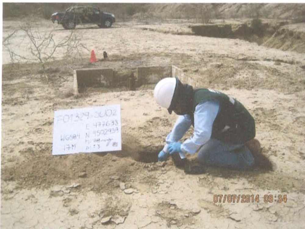
Fotografía N° 4. Toma de muestra de suelo en el punto F01329-SU02, ubicado a 3,6 m aproximadamente al suroeste del Pozo T4592.