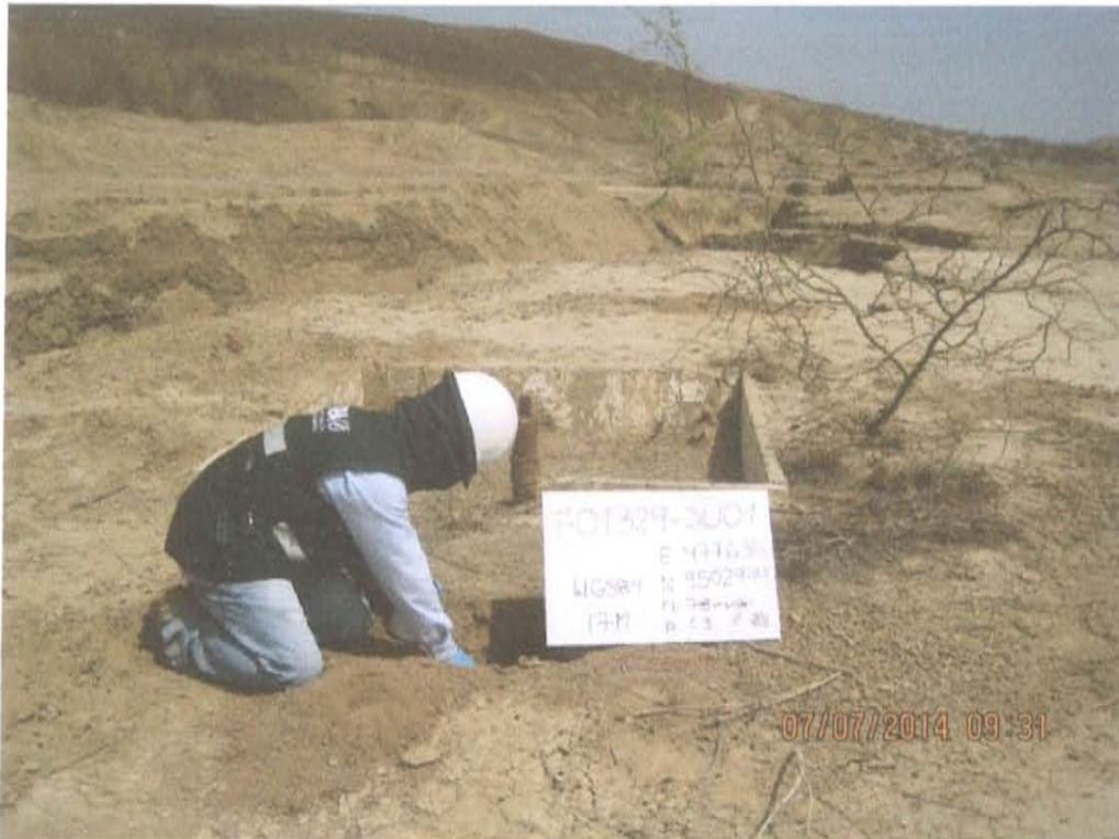
Fotografía N° 3. Toma de muestra de suelo en el punto F01329-SU01, ubicado a 2,5 m aproximadamente al norte del Pozo T4592.

"Año de la Promoción de la Industria Responsable y del Compromiso Climático" "Decenio de las Personas con Discapacidad en el Perú"