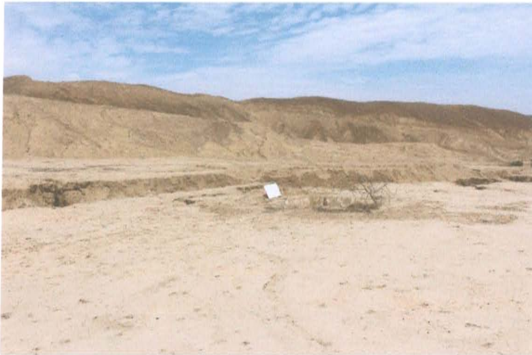
Fotografía N° 2. Vista panorámica del área evaluada del Pozo T4592, presenta superficie natural con suelo arenoso a la margen derecha de una quebrada seca de topografía accidentada con suelos inestables y presencia de cárcavas