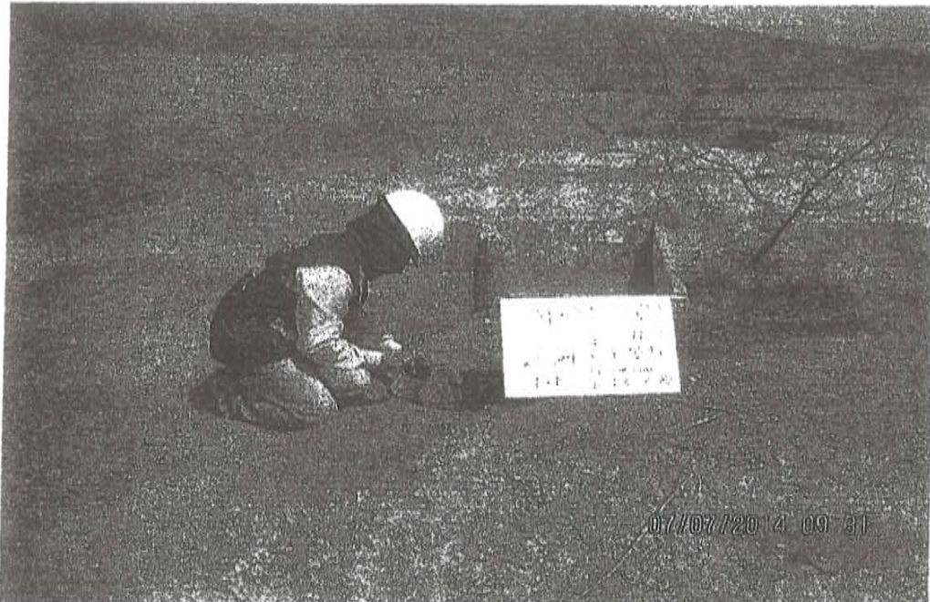
Fotografía N° 1. Toma de muestra de suelo en el punto F01329-SU01, ubicado a 2,5 m aproximadamente al norte del Pozo T4592.

"Decenio de las Personas con Discapacidad en el Perú" "Año de la Promoción de la Industria Responsable y del Compromiso Climático"