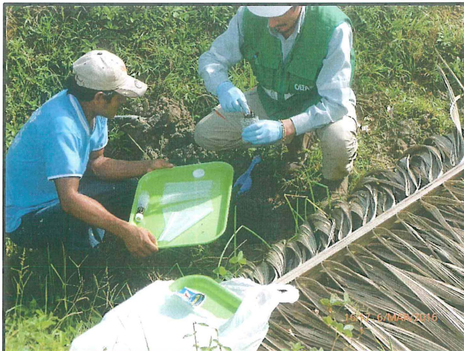
Fotografía N° 1:

DESCRIPCIÓN: Muestreo de suelo a la altura del km 397 + 300 del tramo II del Oleoducto Norperuano, en zona de antiguo derrame.