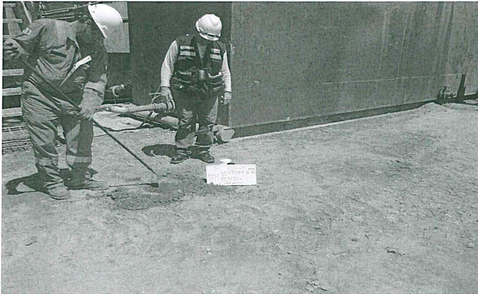
Fotografía N° 6. Punto de muestreo de suelo mediante calicata de 0,30 metros de Profundidad.