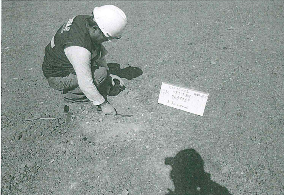
Fotografía N° 2. Punto de muestreo de suelo mediante calicata de 0,20 metros de Profundidad.