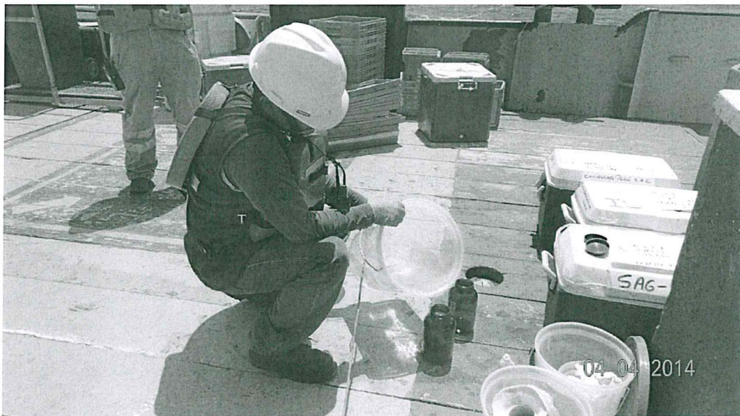
Fotografía N° 6 Toma de Muestra de Agua de Mar del Punto LOB AS - 06