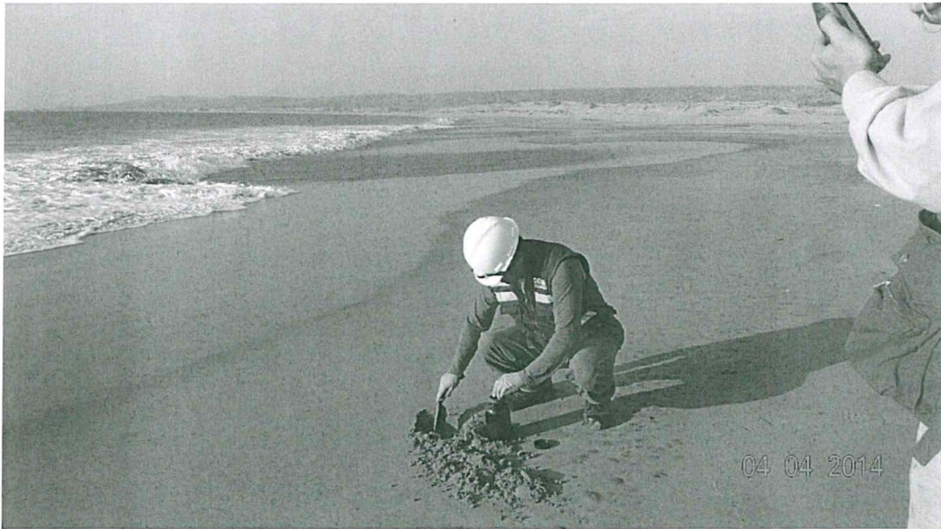
Fotografía N° 8 Toma de Muestra de Suelo del Punto LOB SU - 01

"Decenio de las Personas con Discapacidad en el Perú" "Año de la Promoción de la Industria Responsable y del Compromiso Climático"