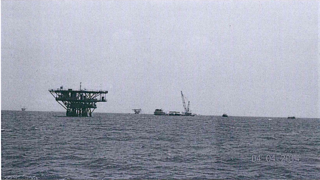
Fotografía N°7 Zona del derrame de Hidrocarburo.

"Decenio de las Personas con Discapacidad en el Perú" "Año de la Promoción de la Industria Responsable y del Compromiso Climático"