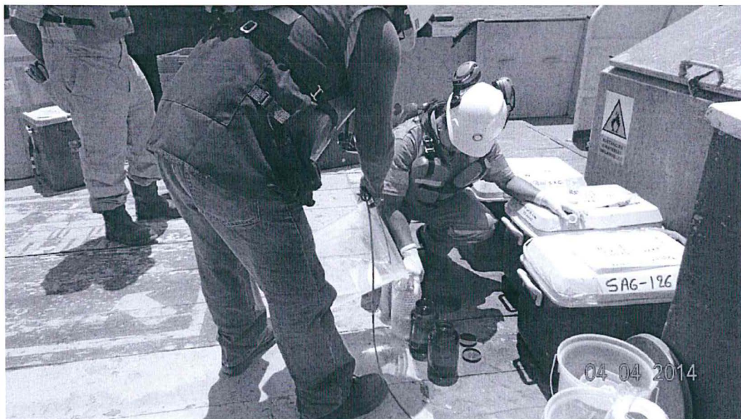
Fotografía N° 4 Toma de Muestra de Agua de Mar del Punto LOB AS - 04