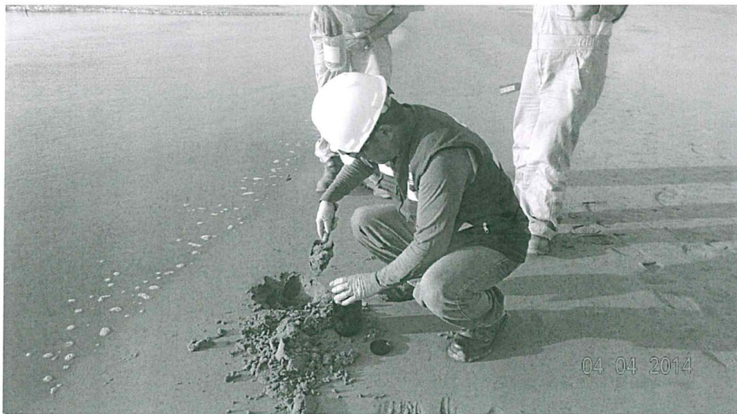
Fotografía N° 9 Toma de Muestra de Suelo del Punto LOB SU - 02