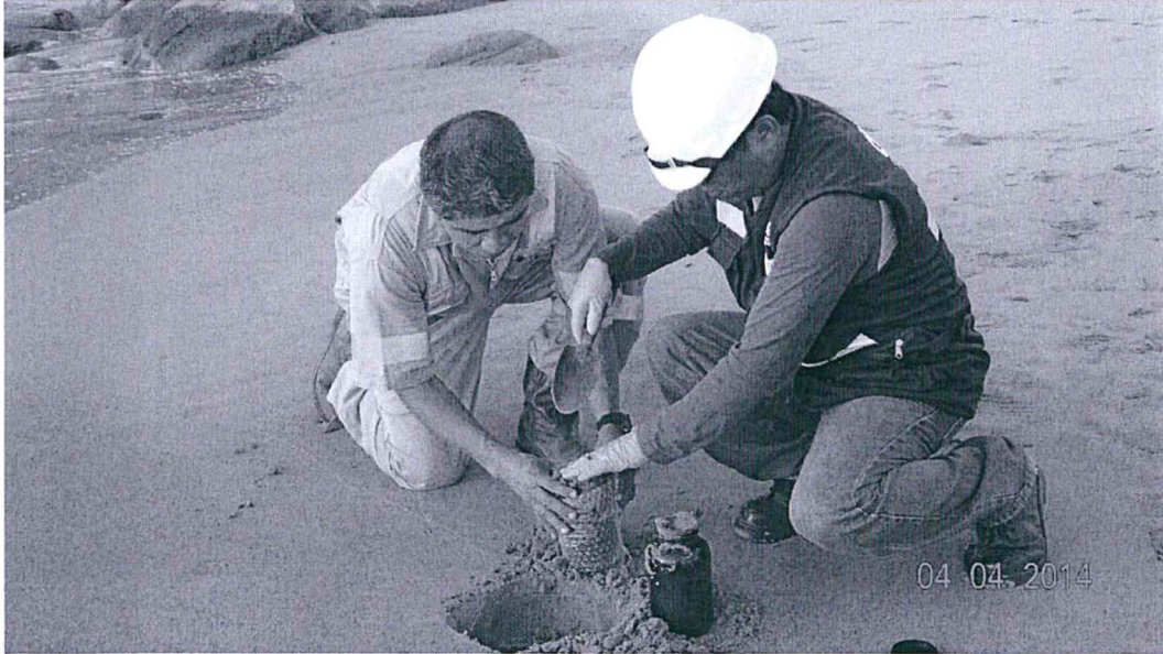
Fotografía N° 10 Toma de Muestra de Suelo del Punto LOB SU - 03

"Decenio de las Personas con Discapacidad en el Perú" "Año de la Promoción de la Industria Responsable y del Compromiso Climático"