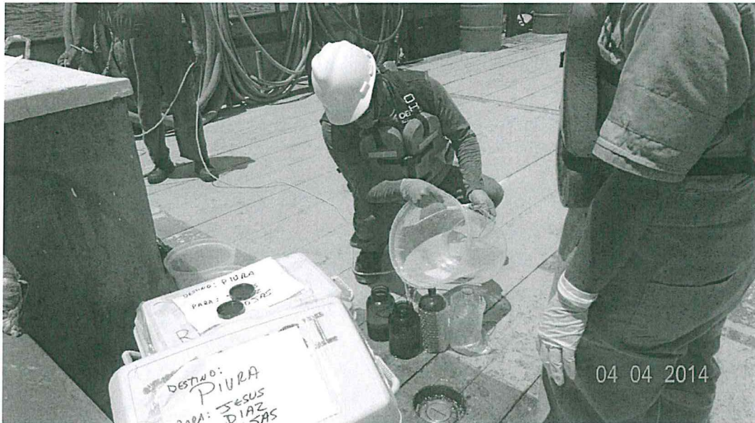
Fotografía N° 1 Toma de Muestra de Agua de Mar del Punto LOB AS - 01

"Decenio de las Personas con Discapacidad en el Perú" "Año de la Promoción de la Industria Responsable y del Compromiso Climático"