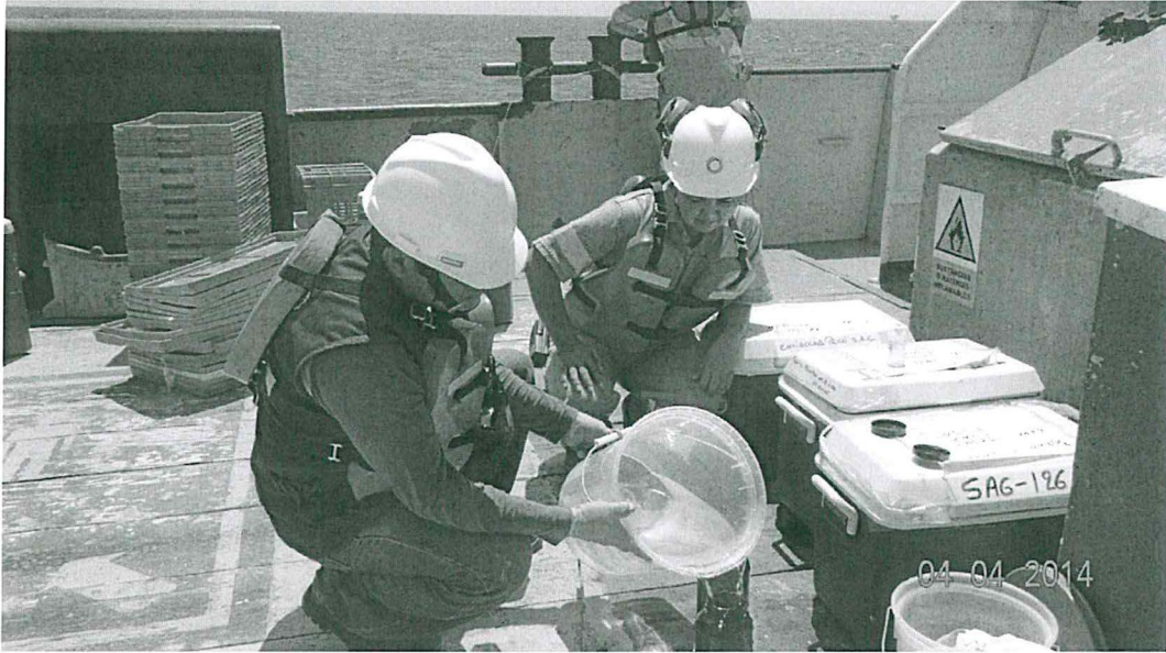
Fotografía N° 5 Toma de Muestra de Agua de Mar del Punto LOB AS - 05

"Decenio de las Personas con Discapacidad en el Perú" "Año de la Promoción de la Industria Responsable y del Compromiso Climático"