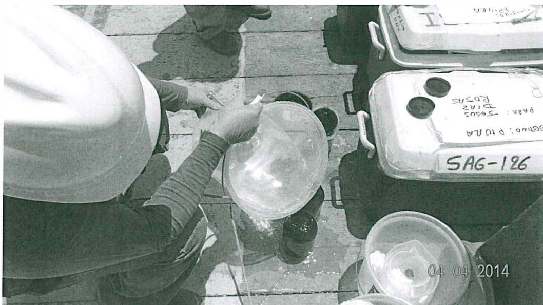
Fotografía N° 2 Toma de Muestra de Agua de Mar del Punto LOB AS - 02