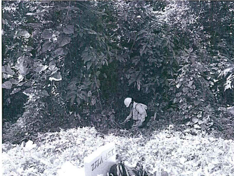
Fotografía N° 4. Punto de monitoreo SU-PP-02 donde se tomó muestras de suelo