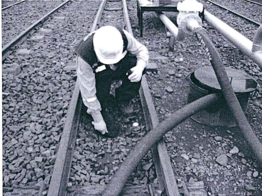
Fotografía 4. Toma de muestra de suelo (S-03) Área remediada denominada "Área C"