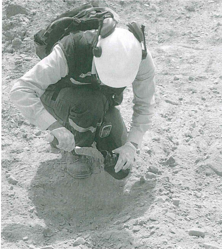
Fotografía N° 2: Punto de Monitoreo de suelo S-XXV-VAL-2