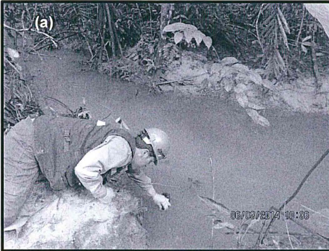
Fotografía N°3: (a) Toma de muestra de agua superficial (AM-2 JI); (b) toma de muestra blanco (AM-3 JI).

“Decenio de las Personas con Discapacidad en el Perú” “Año de la Promoción de la Industria Responsable y del Compromiso Climático”