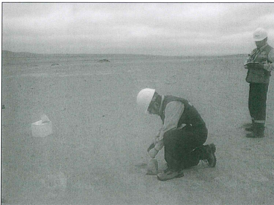
Fotografía 9. Recojo de muestra de suelo (CONT-SU-02) del ex-campamento Ocucaje.

"Decenio de las Personas con Discapacidad en el Perú" "Año de la Promoción de la Industria Responsable y del Compromiso Climático"