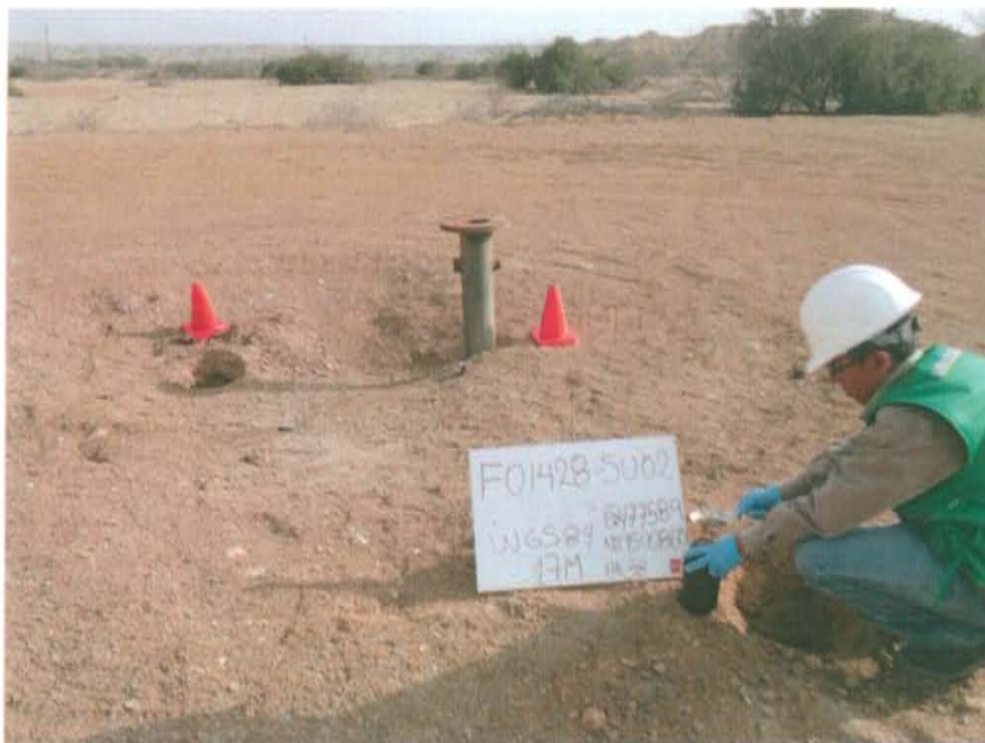
Fotografía N° 4. Recojo de muestra de suelo aproximadamente a 2.5 m noreste del pozo.