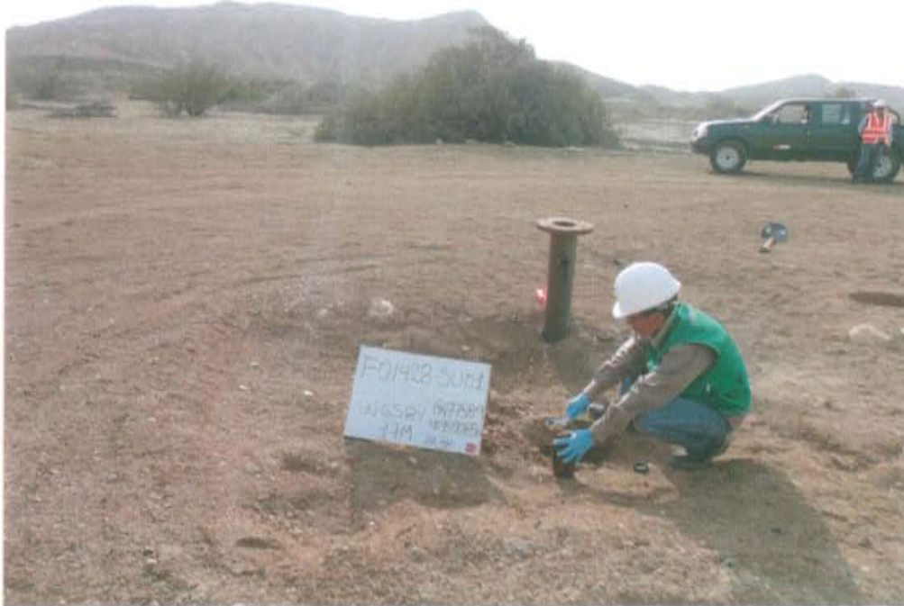
Fotografía N° 3. Recojo de muestra de suelo aproximadamente a 1m al este del pozo.

"Año de la Promoción de la Industria Responsable y del Compromiso Climático" "Decenio de las Personas con Discapacidad en el Perú"