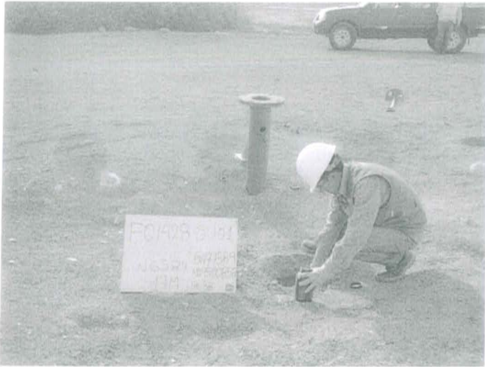
Fotografía N° 1. Toma de muestra de suelo en el punto F01428-SU01, ubicado a 1 m aproximadamente del Pozo T1683.

"Decenio de las Personas con Discapacidad en el Perú" "Año de la Promoción de la Industria Responsable y del Compromiso Climático"