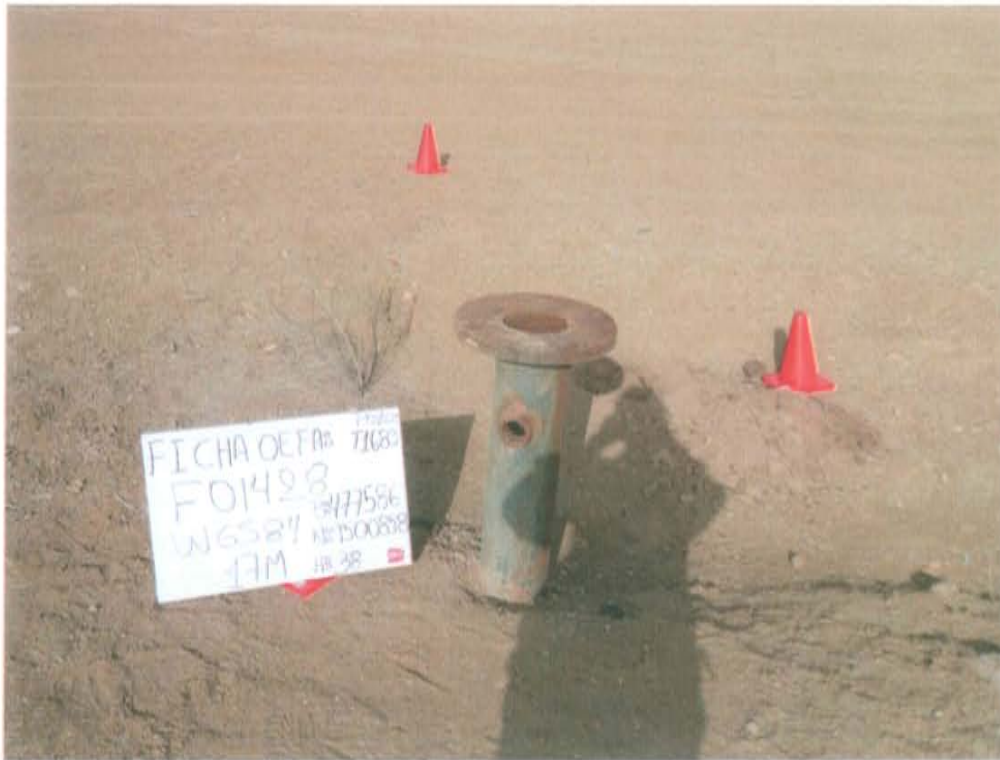
Fotografía N° 1. Pozo inactivo con código PERUPETRO T1683, presenta cabezal con brida expuesta.

"Año de la Promoción de la Industria Responsable y del Compromiso Climático" "Decenio de las Personas con Discapacidad en el Perú"