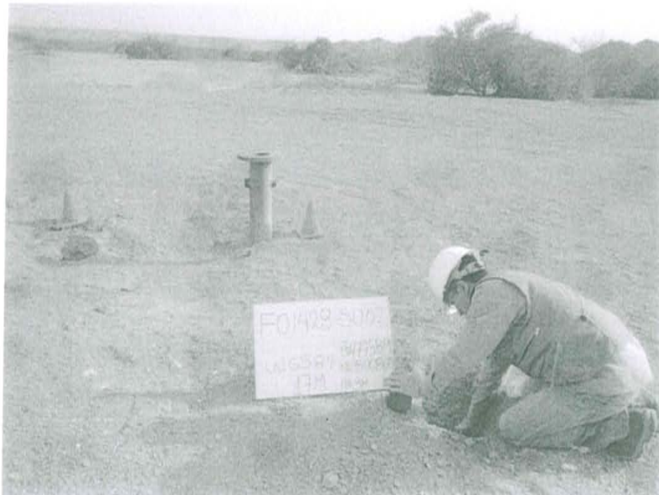
Fotografía N° 2. Toma de muestra de suelo en el punto F01428-SU02, ubicado a 2.5 m aproximadamente del Pozo T1683.