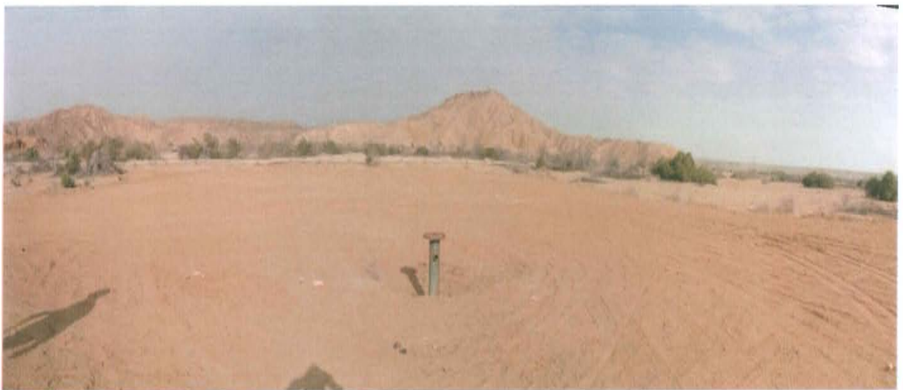
Fotografía N° 2. Área evaluada de relieve plano con presencia de vegetación alrededor como sapote y espino.