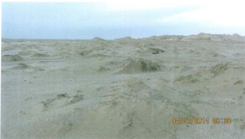
Fotografía N° 2. Vista panorámica del área del Pozo T1155, se caracteriza por su relieve llano y árido, con amplios sectores cubiertos por un manto de arenas eólicas.