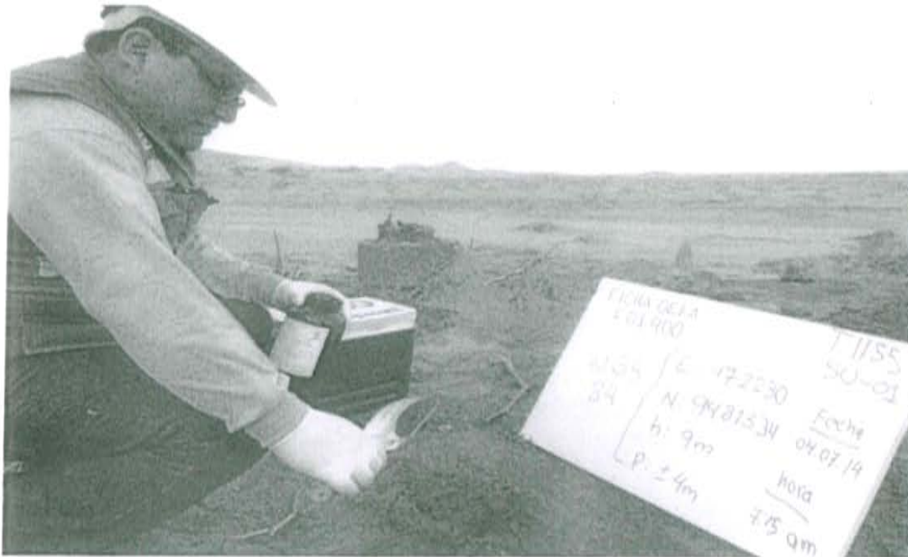
Fotografía N° 1. Toma de muestra de suelo en el punto F01400-SU01, ubicado a 1,5 m aproximadamente del Pozo T1155.

"Decenio de las Personas con Discapacidad en el Perú" "Año de la Promoción de la Industria Responsable y del Compromiso Climático"