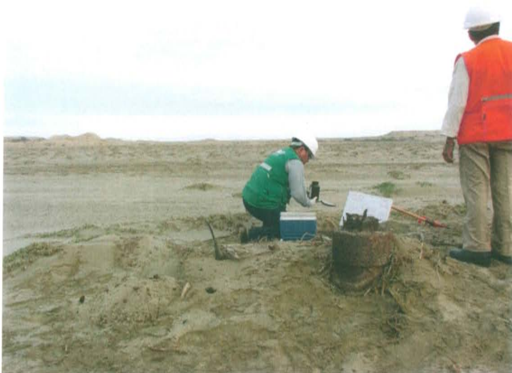
Fotografía N° 4. Toma de muestra de suelo en el punto F01400-SU02, ubicado a 1,6 m aproximadamente del Pozo T1155.