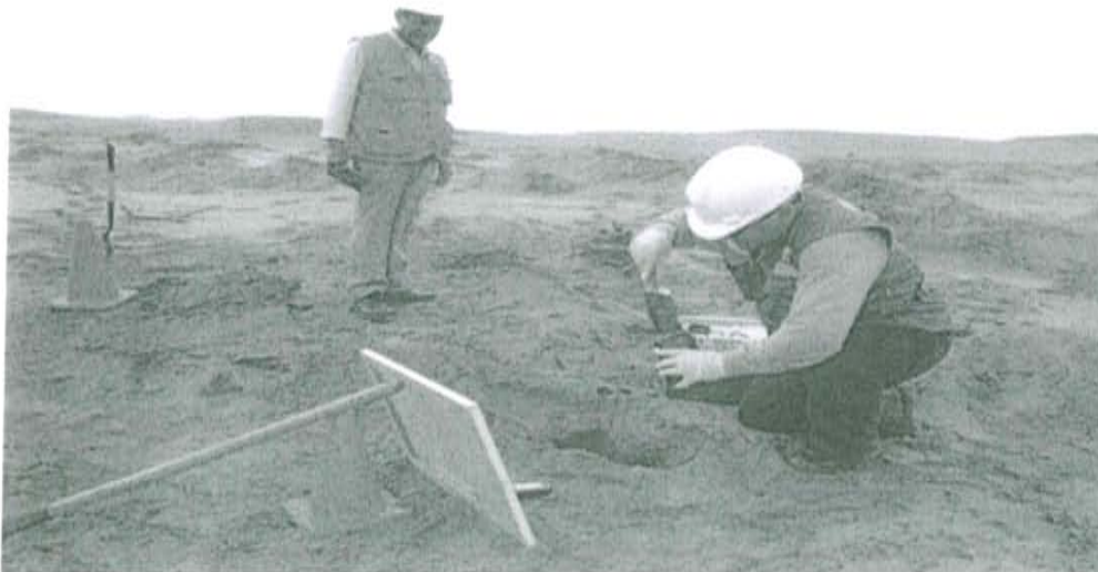
Fotografía N° 2. Toma de muestra de suelo en el punto F01400-SU02, ubicado a 1,6 m aproximadamente del Pozo T1155.