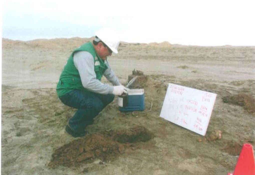
Fotografía N° 3. Toma de muestra de suelo en el punto F01400-SU01, ubicado a 1,5 m aproximadamente del Pozo T1155.

"Año de la Promoción de la Industria Responsable y del Compromiso Climático" "Decenio de las Personas con Discapacidad en el Perú"