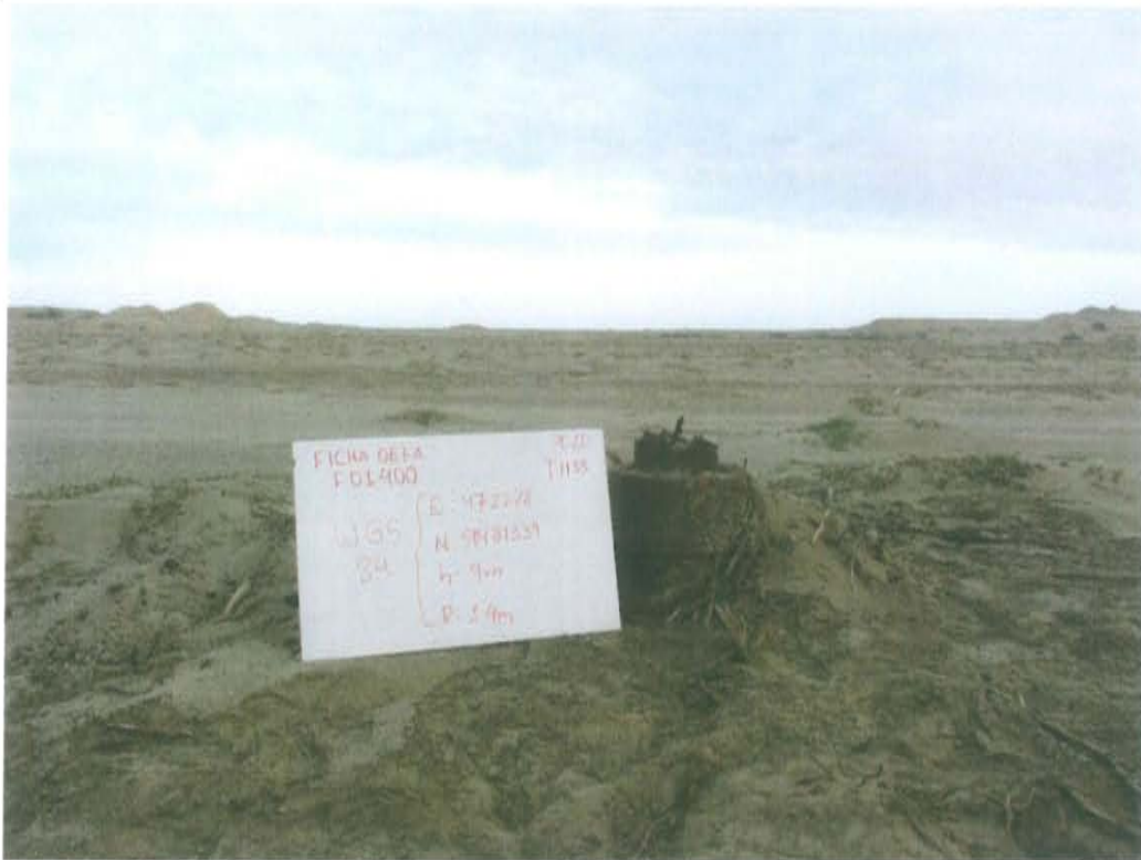
Fotografía N° 1. Se observa 02 casing concéntricos corroídos cementados en la sección anular.

"Año de la Promoción de la Industria Responsable y del Compromiso Climático" "Decenio de las Personas con Discapacidad en el Perú"