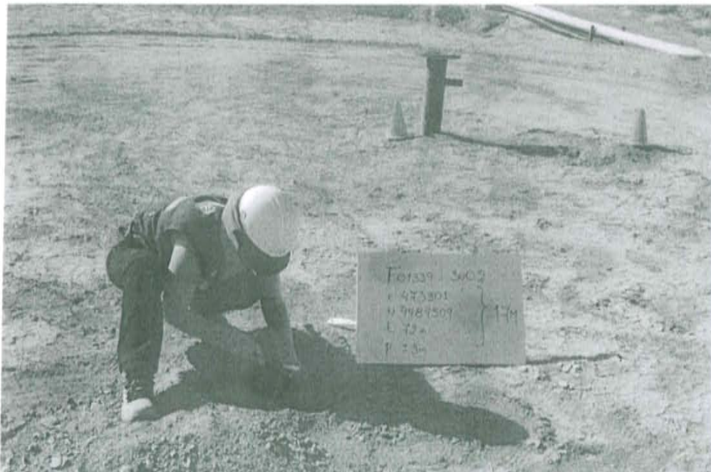
Fotografía N° 2. Toma de muestra en el punto F01339-SU02, ubicado a 4,2 m de distancia del casing del pozo T 2451 a una profundidad de 0,3 m de la superficie del suelo.