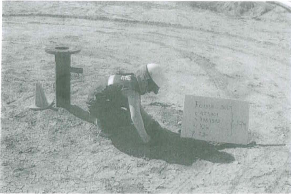
Fotografía N° 1. Toma de muestra en el punto F01339-SU01, ubicado a 1,5 m de distancia del casing del pozo T 2451 a una profundidad de 0,4 m de la superficie del suelo.

"Decenio de las Personas con Discapacidad en el Perú" "Año de la Promoción de la Industria Responsable y del Compromiso Climático"