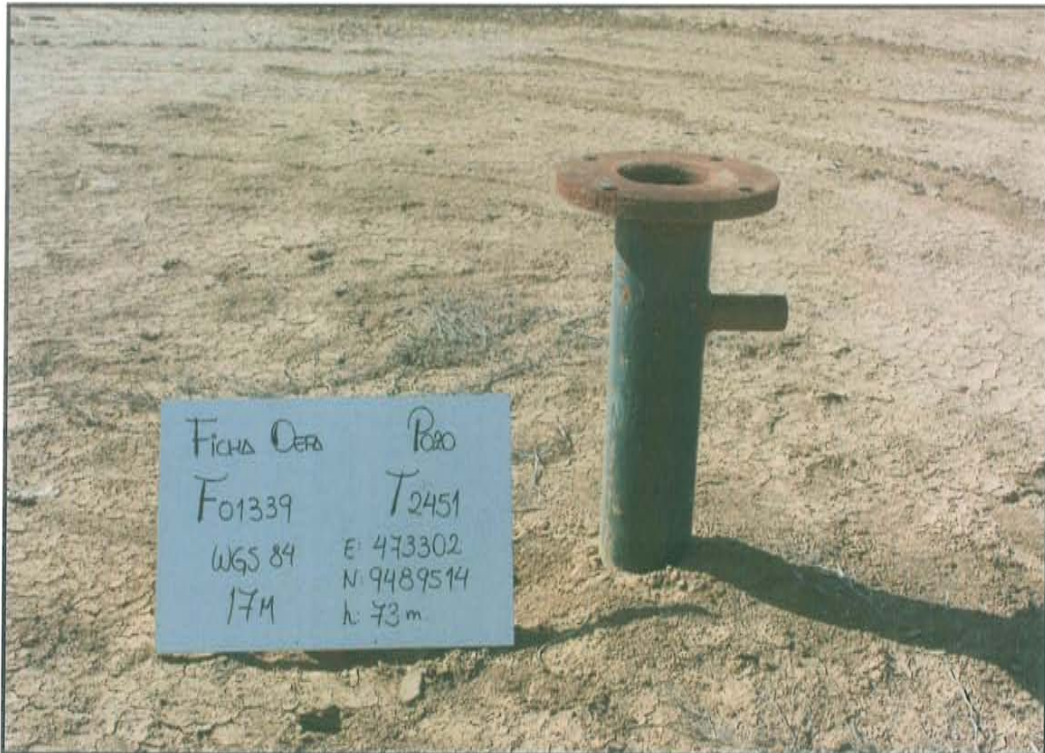
Fotografía N° 1. Pozo T 2451 presenta cabezal de pozo que emerge a una altura de 0,6 m desde la superficie del suelo y cuenta con un tubo de salida lateral de 2 plg.

"Año de la Promoción de la Industria Responsable y del Compromiso Climático" "Decenio de las Personas con Discapacidad en el Perú"