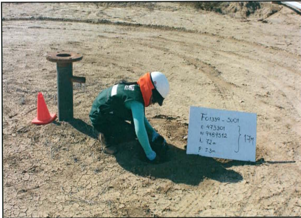
Fotografía N° 3. Toma de muestra en el punto F01339-SU01, ubicado a 1,5 m de distancia del casing del pozo T 2451 a una profundidad de 0,4 m de la superficie del suelo.

"Año de la Promoción de la Industria Responsable y del Compromiso Climático" "Decenio de las Personas con Discapacidad en el Perú"