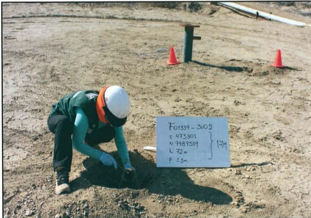
Fotografía N° 4. Toma de muestra en el punto F01339-SU02, ubicado a 4,2 m de distancia del casing del pozo T 2451 a una profundidad de 0,3 m de la superficie del suelo.