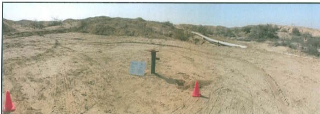
Fotografía N° 2. Vista panorámica del pozo T 2451.