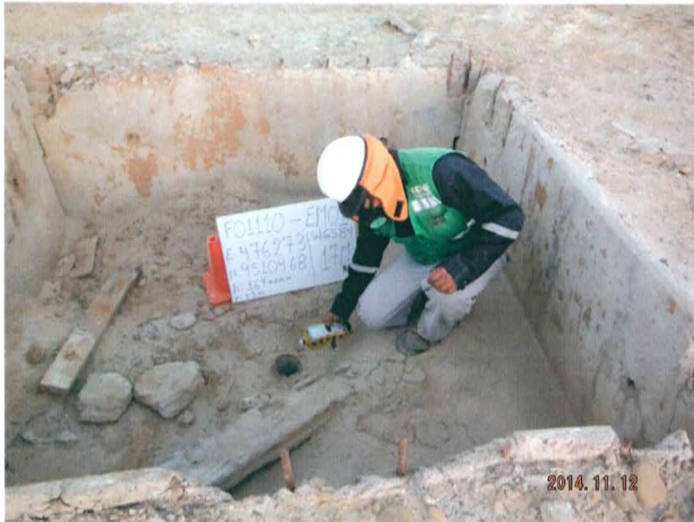
Fotografía N° 4. Medición en el punto F01110-EM01, ubicado en boca del Pozo L1990.