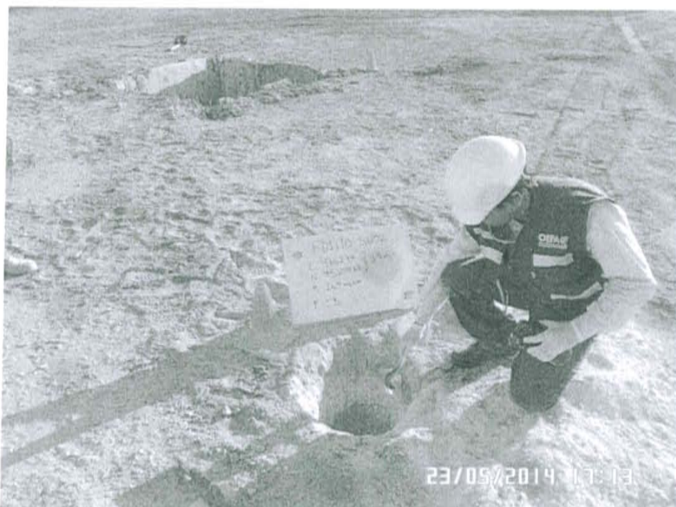
Fotografía N° 2. Toma de muestra de suelo en el punto F01110-SU02, ubicado a 6 m aproximadamente del Pozo L1990.