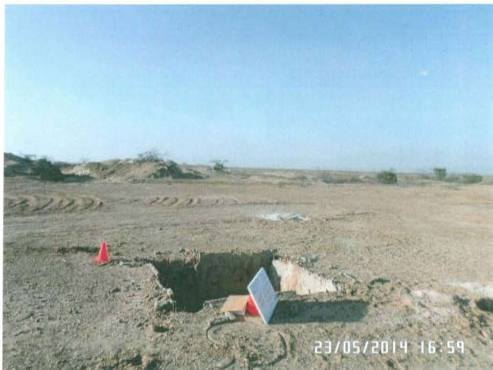
Fotografía N° 2. Vista panorámica del pozo L1990, se observan restos de concreto en el área circundante al pozo.