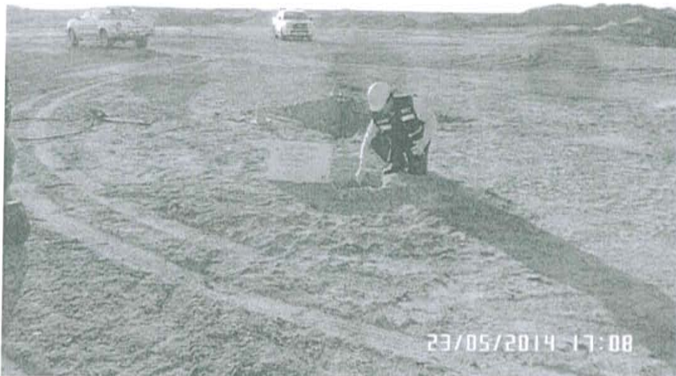
Fotografía N° 1. Toma de muestra de suelo en el punto F01110-SU01, ubicado a 2 m aproximadamente del Pozo L1990.

"Decenio de las Personas con Discapacidad en el Perú" "Año de la Promoción de la Industria Responsable y del Compromiso Climático"