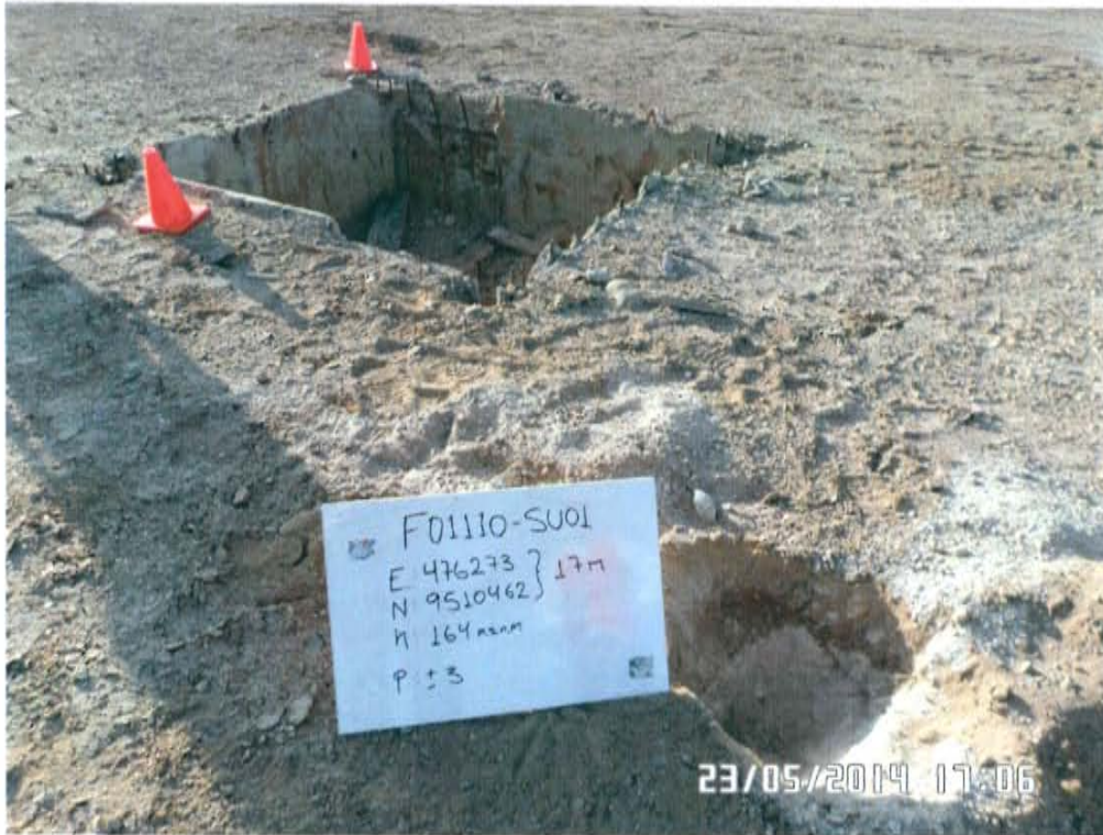
Fotografía N° 3. Vista del punto de muestreo F01110-SU01, ubicado a 2 m del pozo donde se observa suelo impregnado con hidrocarburos.

"Año de la Promoción de la Industria Responsable y del Compromiso Climático" "Decenio de las Personas con Discapacidad en el Perú"