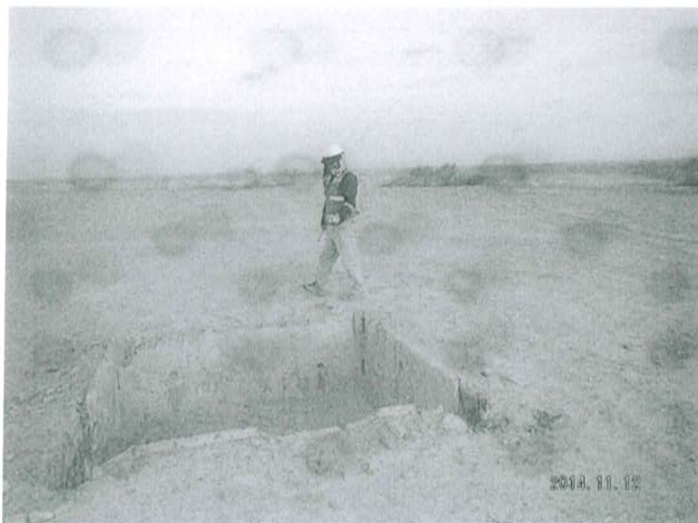
Fotografía N° 2. Mediciones en F01110-VA01, recorrido en el área circundante alrededor del Pozo L1990.