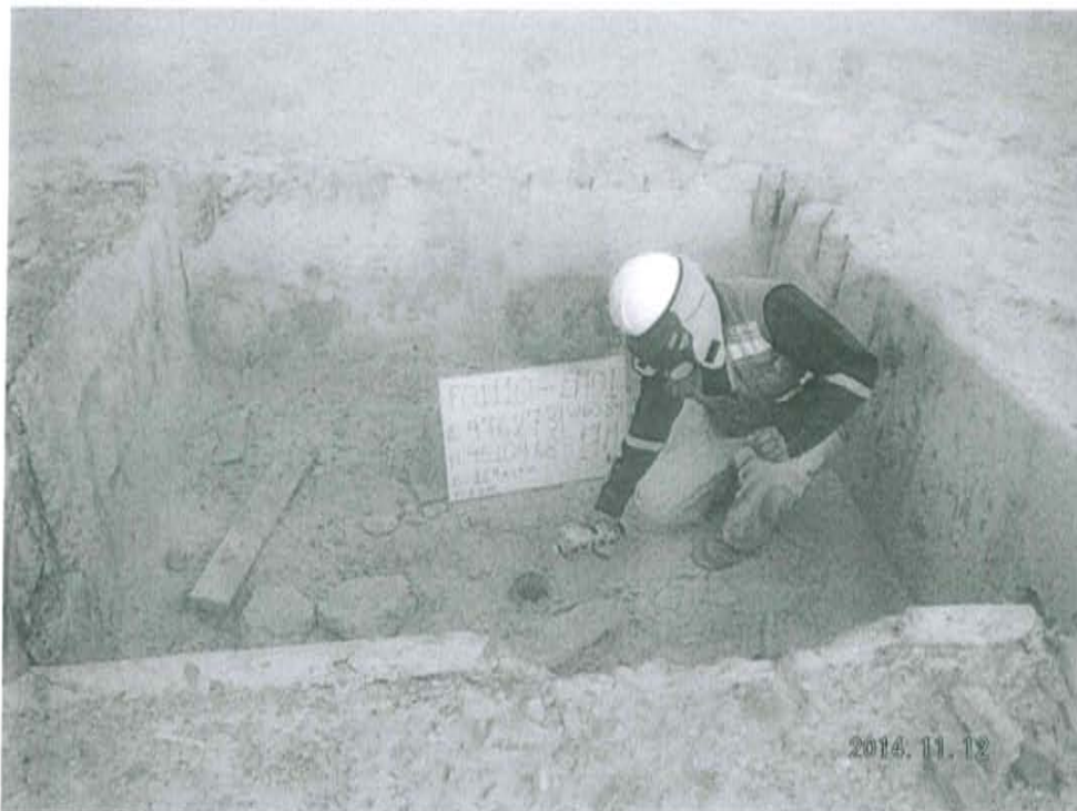
Fotografía N° 1. Medición en el punto F01110-EM01, ubicado en boca del Pozo L1990.

"Año de la Promoción de la Industria Responsable y del Compromiso Climático" "Decenio de las Personas con Discapacidad en el Perú"