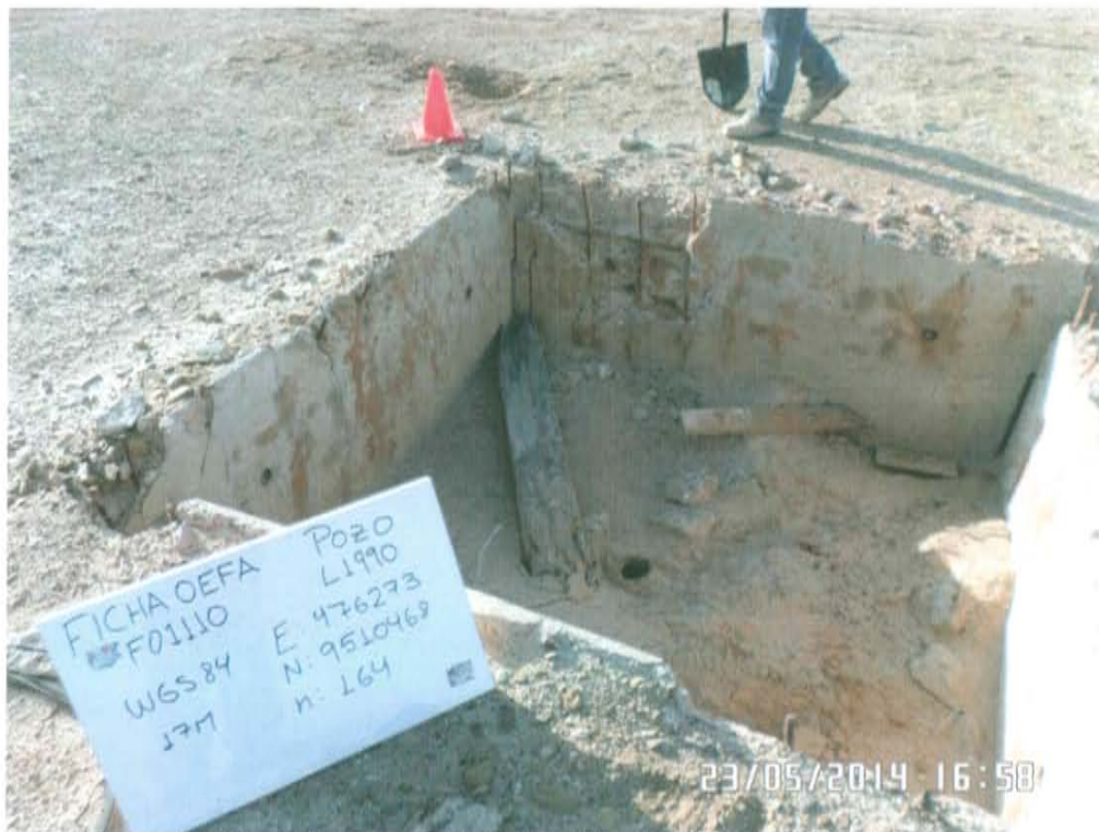
Fotografía N° 1. Vista pozo L1990 ubicado en una planicie, se observa el casing a nivel del suelo y dentro de una cantina desgastada.

"Año de la Promoción de la Industria Responsable y del Compromiso Climático" "Decenio de las Personas con Discapacidad en el Perú"