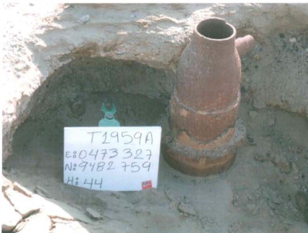
Fotografía N° 1. Vista pozo T1959A ubicado en una planicie que no presenta vía de acceso.

"Año de la Promoción de la Industria Responsable y del Compromiso Climático" "Decenio de las Personas con Discapacidad en el Perú"