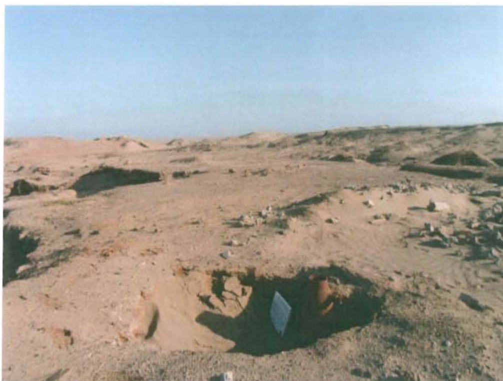
Fotografía N° 2. Vista panorámica del pozo T1959A, se observa suelo contaminado con hidrocarburos en el área circundante al pozo.