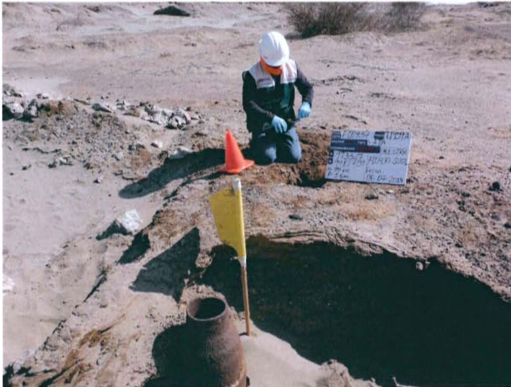
Fotografía N° 3. Vista del punto de muestreo F00437-SU01 ubicado a 1,8 m del pozo.

"Año de la Promoción de la Industria Responsable y del Compromiso Climático" "Decenio de las Personas con Discapacidad en el Perú"