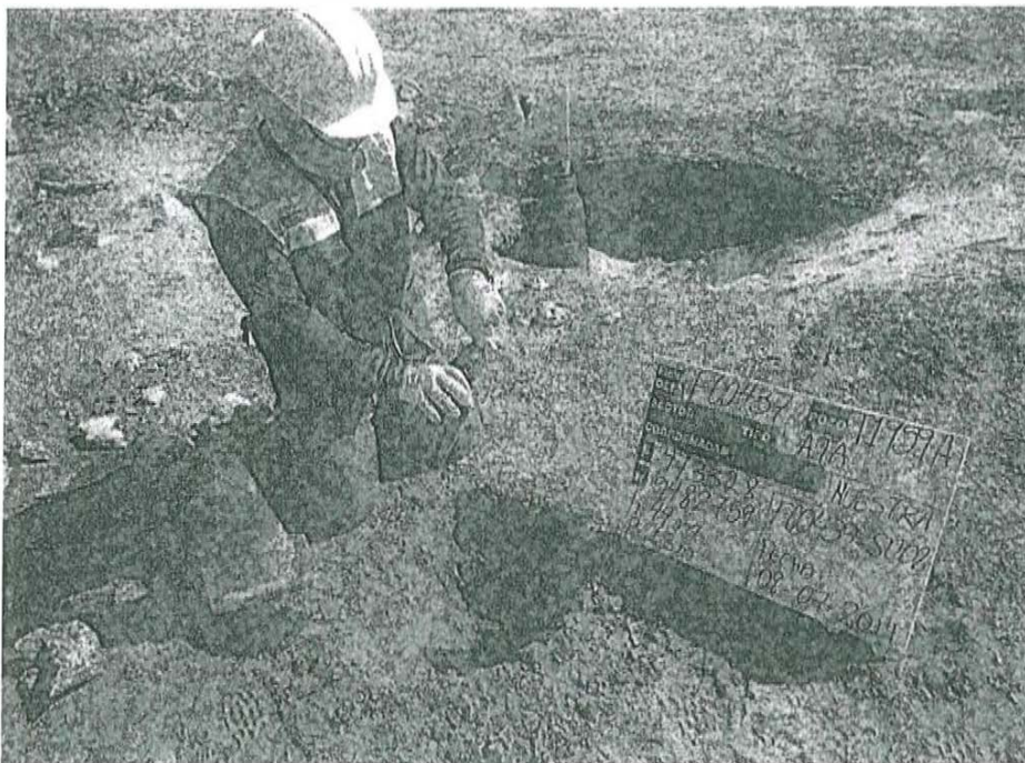
Fotografía N° 2. Toma de muestra de suelo en el punto F00437-SU02, ubicado a 3 m aproximadamente del pozo T1959A