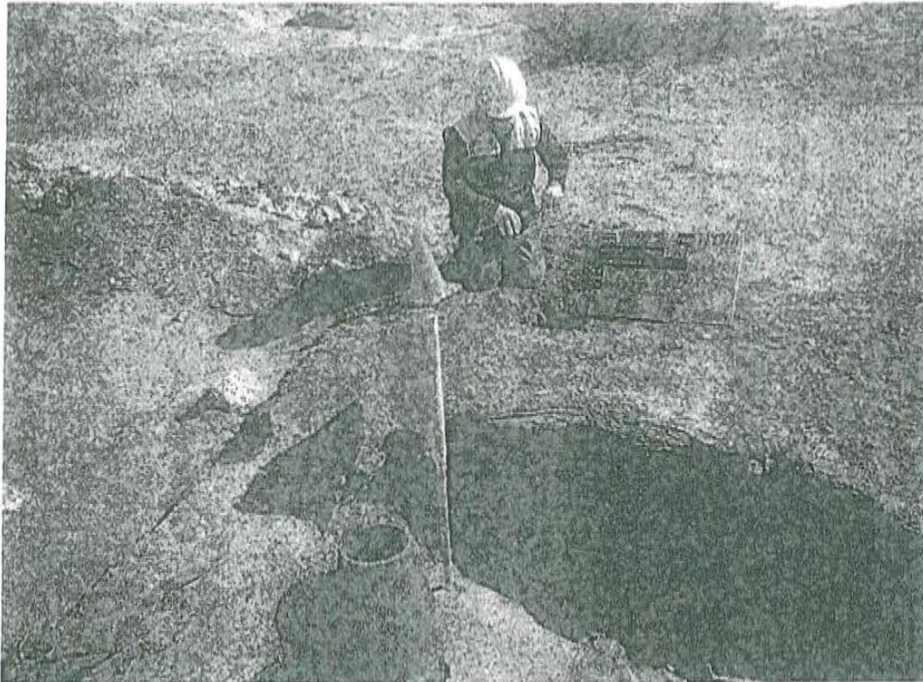
Fotografía N° 1. Toma de muestra de suelo en el punto F00437-SU01, ubicado a 1,80 m aproximadamente del pozo T1959A

"Decenio de las Personas con Discapacidad en el Perú" "Año de la Promoción de la Industria Responsable y del Compromiso Climático"