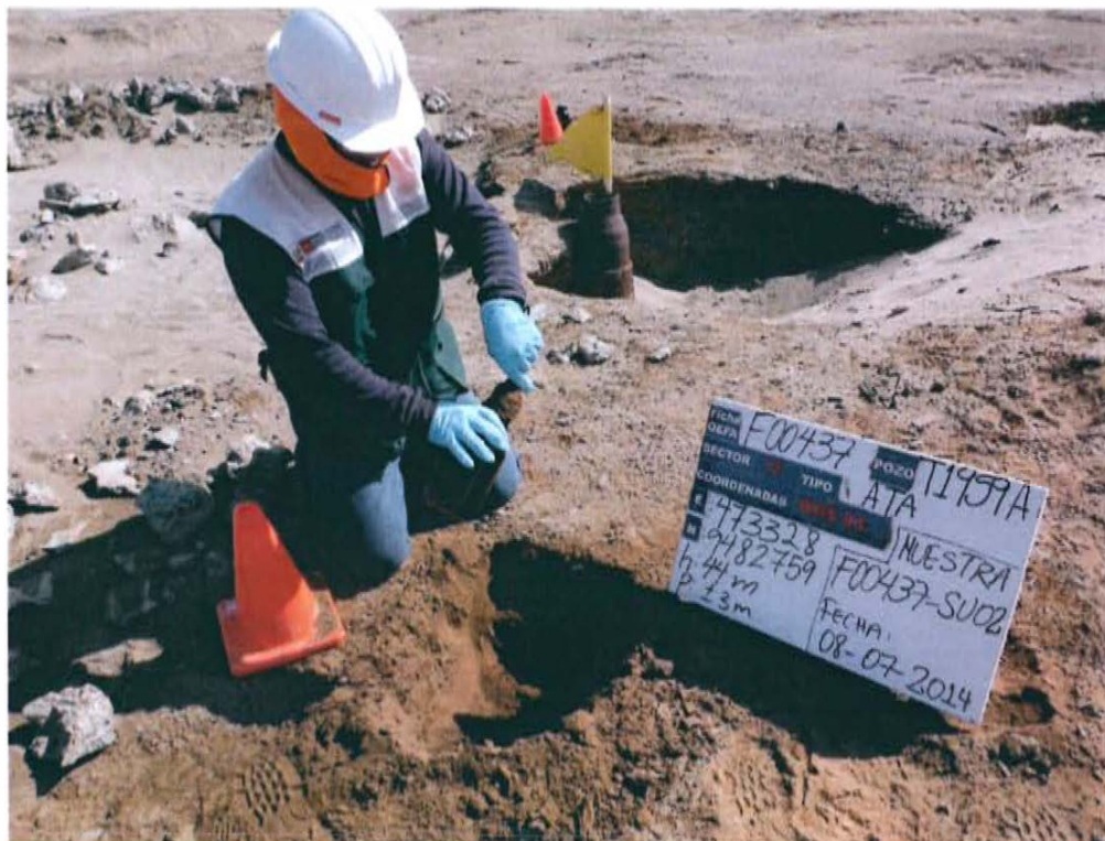
Fotografía N° 4. Vista del punto de muestreo F00437-SU02 ubicado a 3 m del pozo.