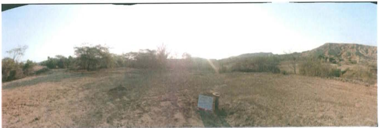
Fotografía N° 2. Zona evaluada de relieve plano con presencia de vegetación como sapote y espino.