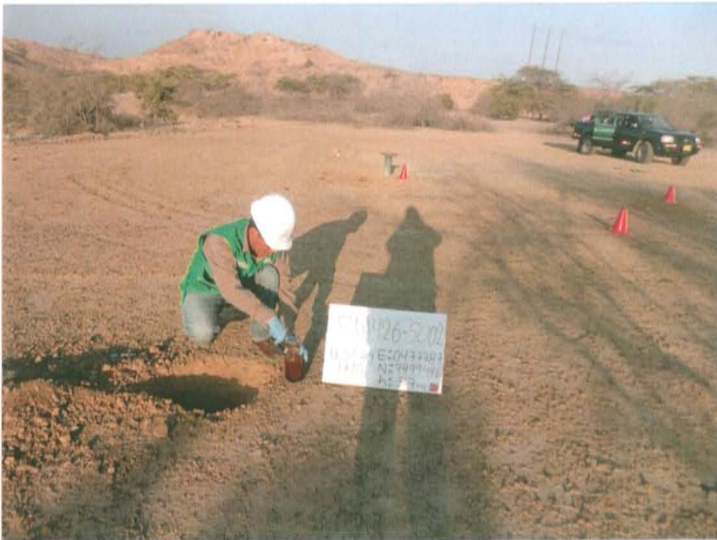
Fotografía N° 4. Toma de muestra aproximadamente a 7 m al oeste del pozo.