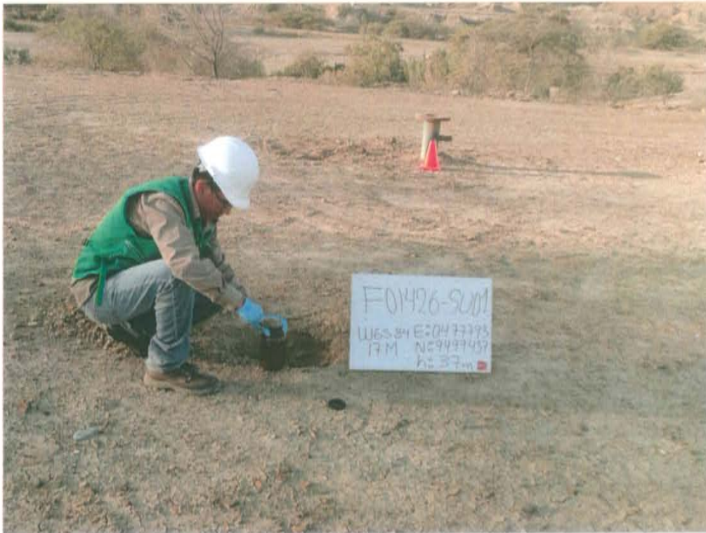
Fotografía N° 3. Toma de muestra aproximadamente a 4 m al suroeste del pozo.

"Año de la Promoción de la Industria Responsable y del Compromiso Climático" "Decenio de las Personas con Discapacidad en el Perú"