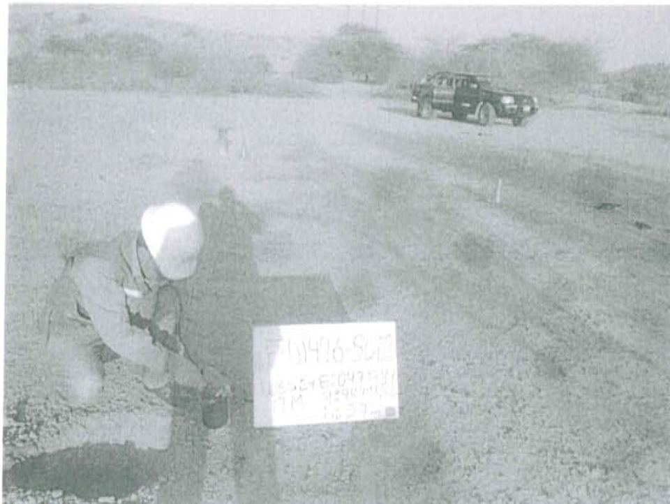
Fotografía N° 2. Toma de muestra de suelo en el punto F01426-SU02, ubicado a 7 m aproximadamente del Pozo T2872.