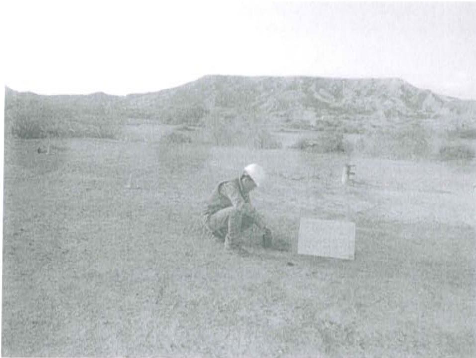
Fotografía N° 1. Toma de muestra de suelo en el punto F01426-SU01, ubicado a 4 m aproximadamente del Pozo T2872.

"Decenio de las Personas con Discapacidad en el Perú" "Año de la Promoción de la Industria Responsable y del Compromiso Climático"