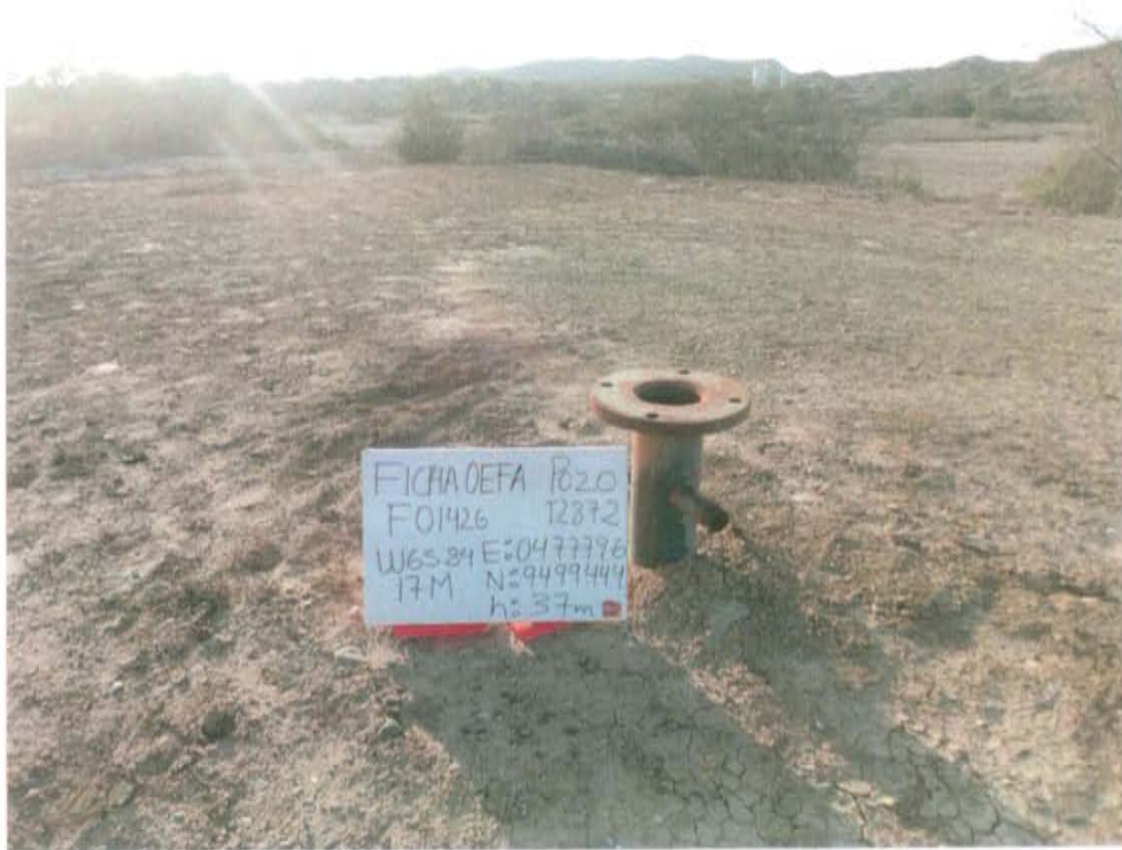
Fotografía N° 1. Pozo inactivo con código PERUPETRO T2872, con cabezal y brida expuesta no cerrado.

"Año de la Promoción de la Industria Responsable y del Compromiso Climático" "Decenio de las Personas con Discapacidad en el Perú"