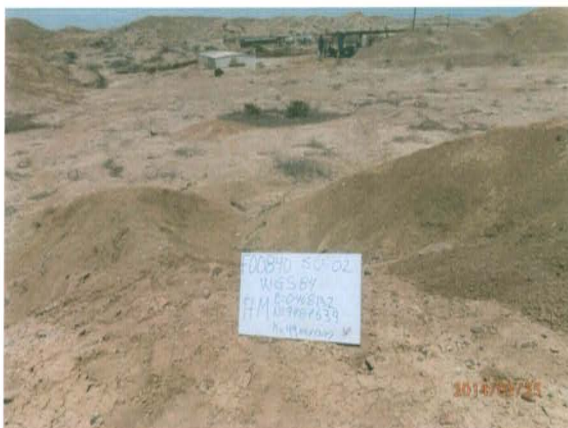
Fotografía N° 4. Toma de muestra de suelo en el punto F00840-SU02 a 20 m del Pozo y a una profundidad de 0,55 m de la superficie del suelo.