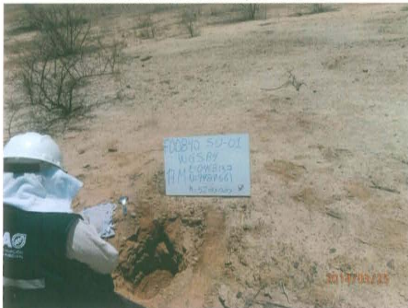
Fotografía N° 3. Toma de muestra de suelo en el punto F00840-SU01 a 0,80 m del pozo y a una profundidad de 0,45 m de la superficie del suelo.

"Año de la Promoción de la Industria Responsable y del Compromiso Climático" "Decenio de las Personas con Discapacidad en el Perú"