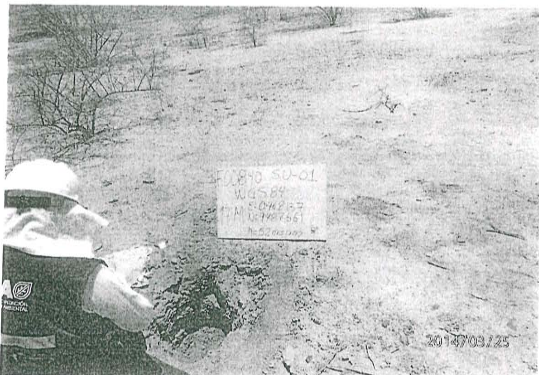
Fotografía N° 1. Toma de muestra de suelo en el punto F00840-SU01, ubicado a 0,80 m aproximadamente del Pozo T4832.