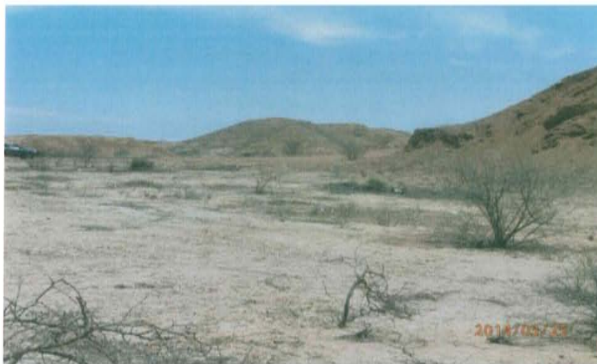
Fotografía N° 2. Se observa vegetación seca alrededor del pozo, ubicado en la unidad fisiográfica colinas bajas moderadamente onduladas.