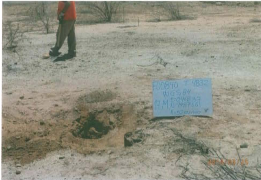
Fotografía N° 1. Pozo inactivo mal abandonado, sin cabezal con casing abierto y casi cubierto con tierra al ras del suelo.

"Año de la Promoción de la Industria Responsable y del Compromiso Climático" "Decenio de las Personas con Discapacidad en el Perú"