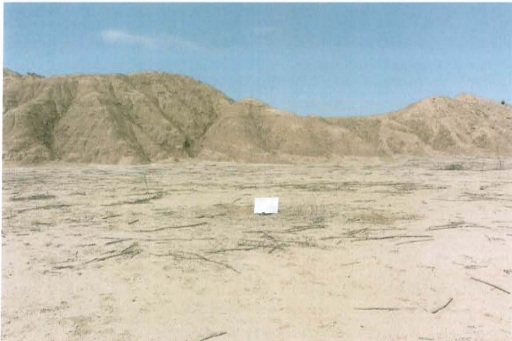
Fotografía N° 2. Vista panorámica del área evaluada del Pozo T5346, se caracteriza por presentar superficie natural con suelo arenoso.