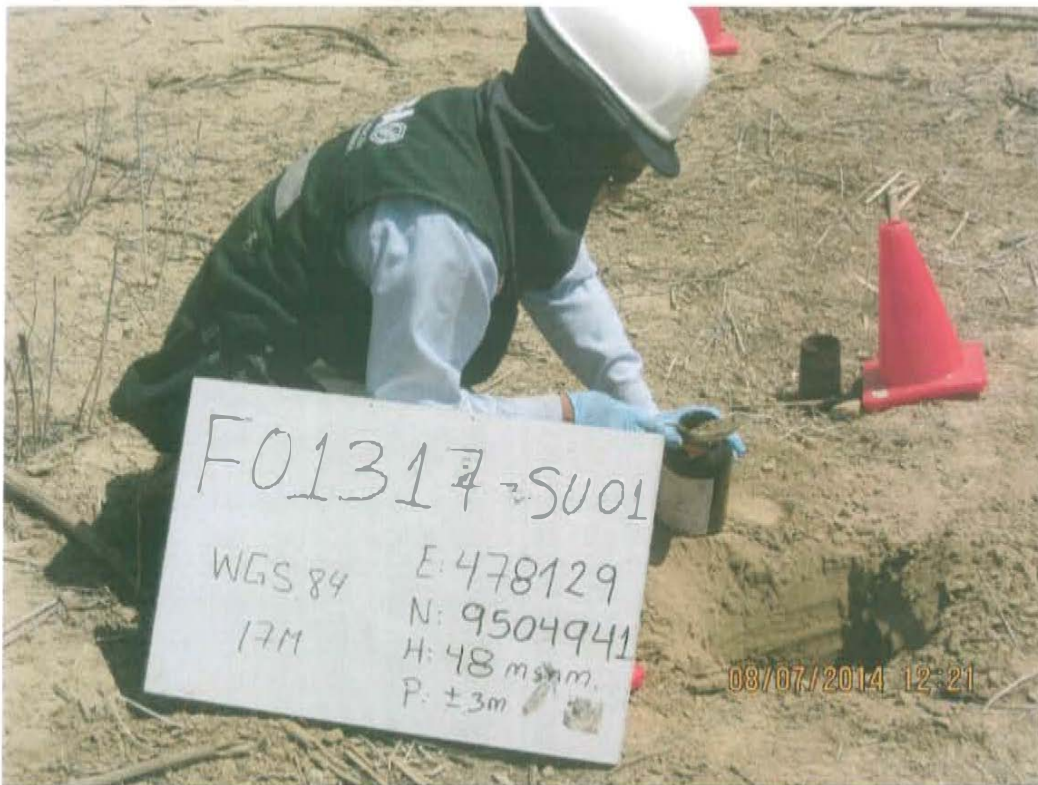
Fotografía N° 3. Toma de muestra de suelo en el punto F01317-SU01, ubicado a 0,89 m aproximadamente al este del Pozo T5346.

"Año de la Promoción de la Industria Responsable y del Compromiso Climático" "Decenio de las Personas con Discapacidad en el Perú"