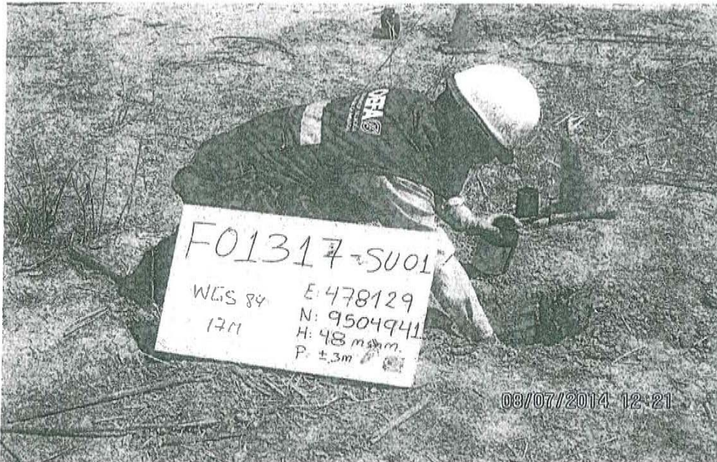
Fotografía N° 1. Toma de muestra de suelo en el punto F01317-SU01, ubicado a 0,89 m aproximadamente al este del Pozo T5346.

"Decenio de las Personas con Discapacidad en el Perú" "Año de la Promoción de la Industria Responsable y del Compromiso Climático"