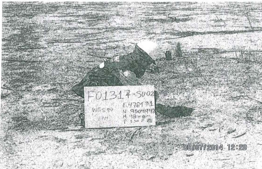
Fotografía N° 2. Toma de muestra de suelo en el punto F01317-SU02, ubicado a 2,7 m aproximadamente al oeste del Pozo T5346.