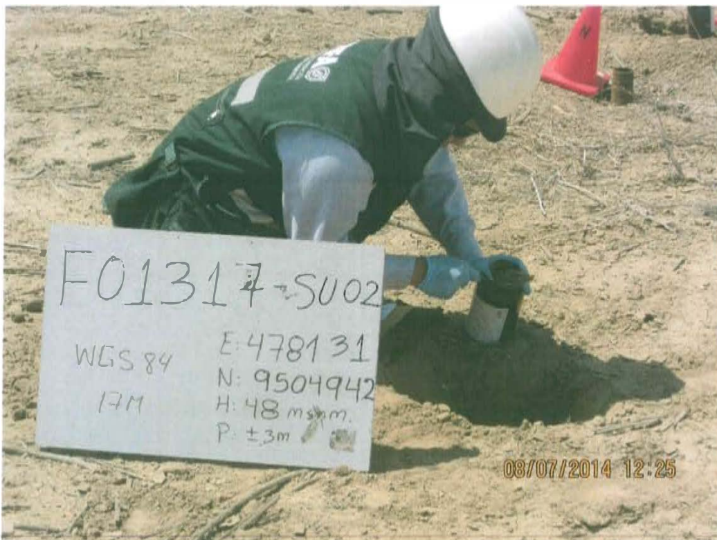
Fotografía N° 4. Toma de muestra de suelo en el punto F01317-SU02, ubicado a 2,7 m aproximadamente al oeste del Pozo T5346.