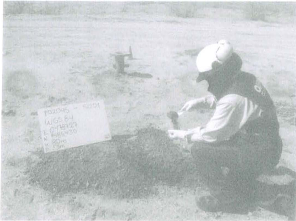
Fotografía N° 1. Toma de muestra de suelo en el punto F02045-SU01, ubicado a 3 m aproximadamente del Pozo T2998.

"Decenio de las Personas con Discapacidad en el Perú" "Año de la Promoción de la Industria Responsable y del Compromiso Climático"