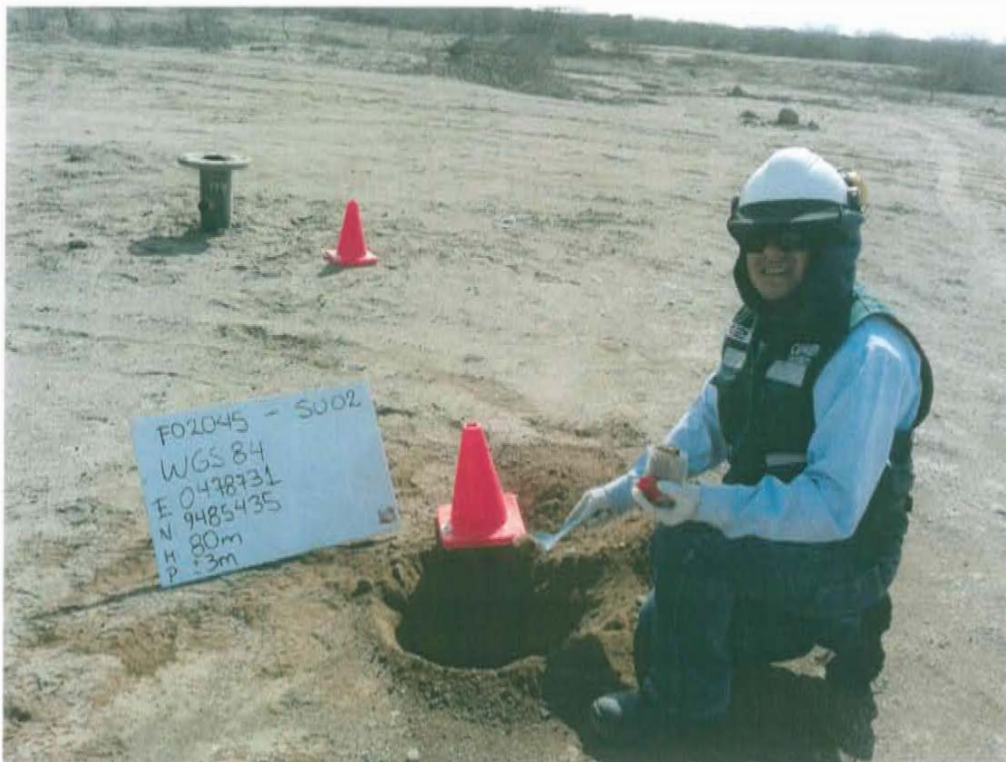
Fotografía N° 4. Toma de muestra de suelo en el punto F02045-SU02, ubicado a 4 m aproximadamente del Pozo T2998.