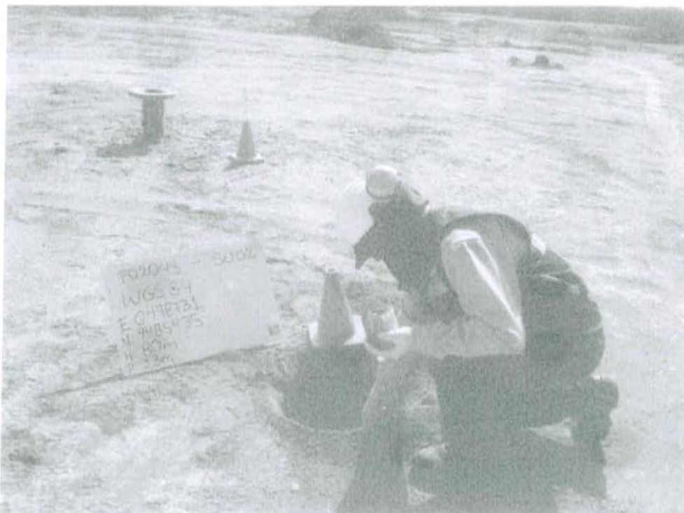
Fotografía N° 2. Toma de muestra de suelo en el punto F02045-SU02, ubicado a 4 m aproximadamente del Pozo T2998.