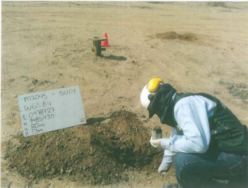
Fotografía N° 3. Toma de muestra de suelo en el punto F02045-SU01, ubicado a 3 m aproximadamente del Pozo T2998.

"Año de la Promoción de la Industria Responsable y del Compromiso Climático" "Decenio de las Personas con Discapacidad en el Perú"