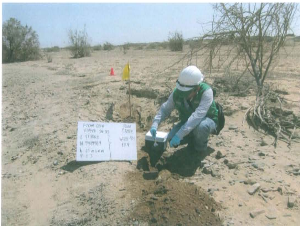
Fotografía N° 3. Toma de muestra de suelo en el punto F01948 -SU01, ubicado a 1,8 m en dirección sur del Pozo T3287.

"Año de la Promoción de la Industria Responsable y del Compromiso Climático" "Decenio de las Personas con Discapacidad en el Perú"