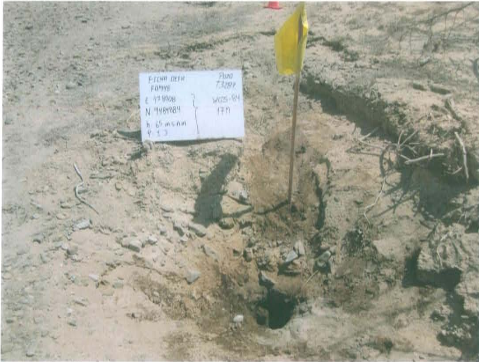
Fotografía N° 1. Se observa el Pozo T3287 con casing de 8 pulgadas al ras del suelo abierto y expuesto al ambiente.

"Año de la Promoción de la Industria Responsable y del Compromiso Climático" "Decenio de las Personas con Discapacidad en el Perú"