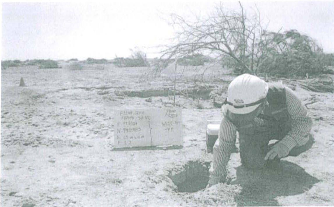
Fotografía N° 2. Toma de muestra de suelo en el punto F01948-SU02, ubicado a 2,8 m aproximadamente del Pozo.