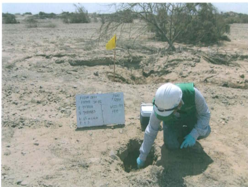
Fotografía N° 4. Toma de muestra de suelo en el punto F01948 -SU02, ubicado a 2,8 m en dirección oeste del Pozo T3287.