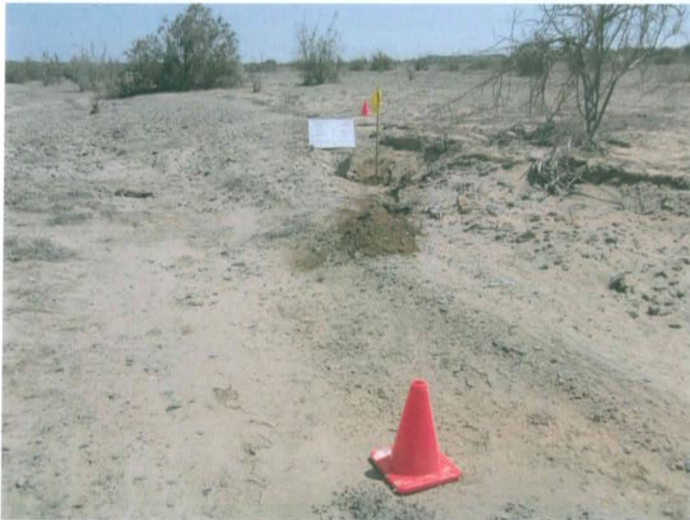
Fotografía N° 2. La zona donde se ubica el Pozo T3287 presenta un paisaje plano suavemente ondulado con vegetación de bosques secos y arbustivos.