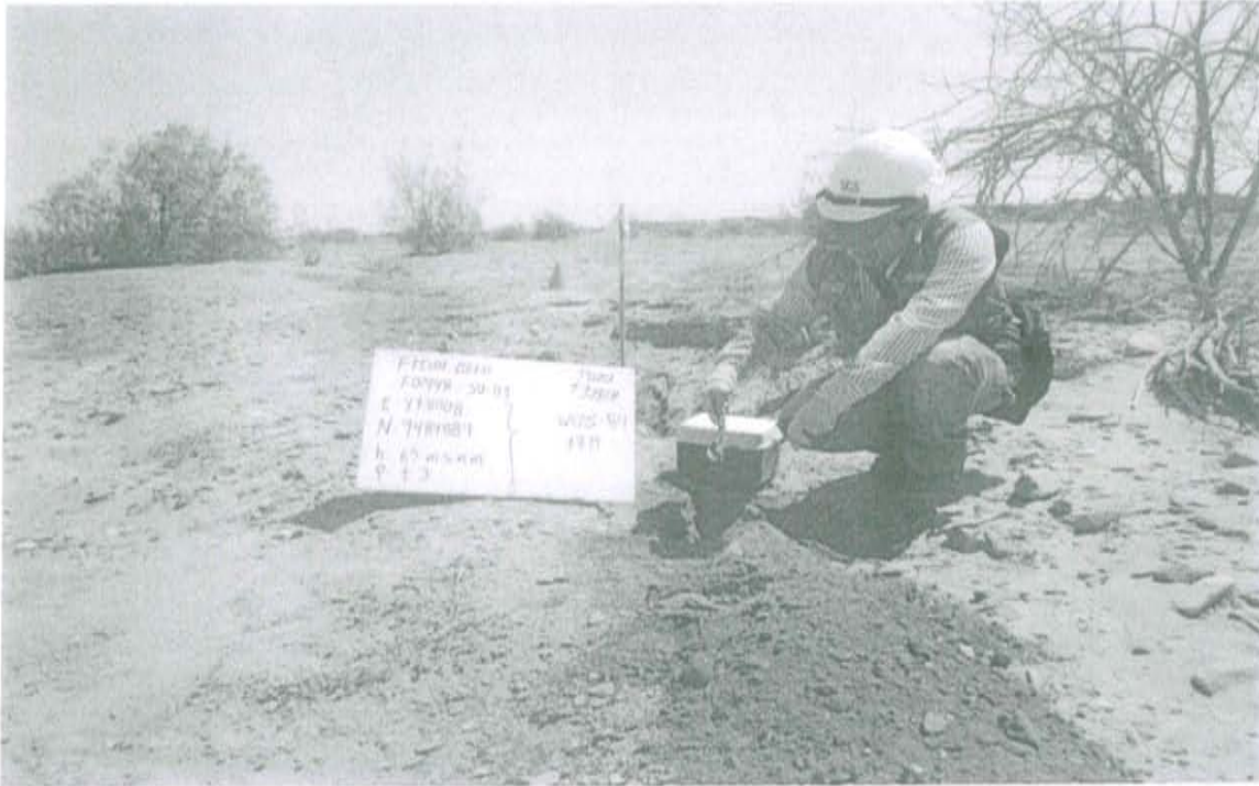
Fotografía N° 1. Toma de muestra de suelo en el punto F01948-SU01, ubicado a 1,8 m aproximadamente del Pozo.

"Decenio de las Personas con Discapacidad en el Perú" "Año de la Promoción de la Industria Responsable y del Compromiso Climático"