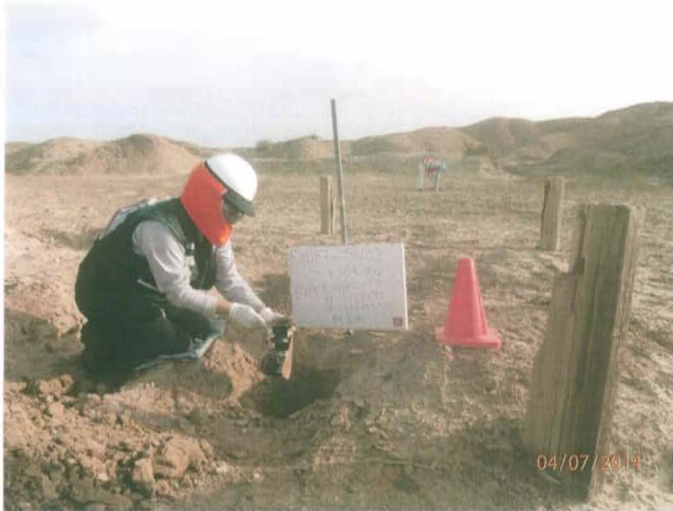
Fotografía N° 3. Toma de muestra de suelo en el punto F01187-SU01, ubicado a 2 m aproximadamente del Pozo T3758.

"Año de la Promoción de la Industria Responsable y del Compromiso Climático" "Decenio de las Personas con Discapacidad en el Perú"