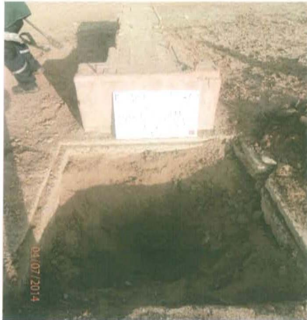
Fotografía N° 1. Pozo inactivo se encuentra abierto y expuesto al ambiente.

"Año de la Promoción de la Industria Responsable y del Compromiso Climático" "Decenio de las Personas con Discapacidad en el Perú"