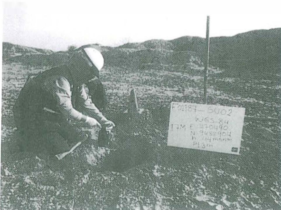
Fotografía N° 2. Toma de muestra de suelo en el punto F01187-SU02, ubicado a 25 m aproximadamente del Pozo T3758.