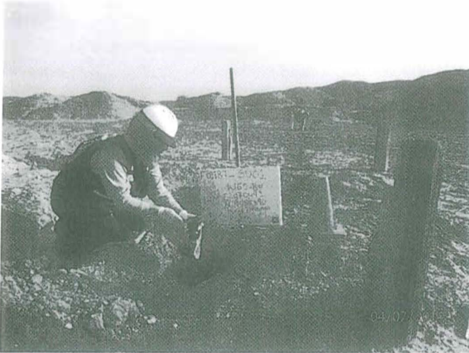
Fotografía N° 1. Toma de muestra de suelo en el punto F01187-SU01, ubicado a 2 m aproximadamente del Pozo T3758.

"Decenio de las Personas con Discapacidad en el Perú" "Año de la Promoción de la Industria Responsable y del Compromiso Climático"