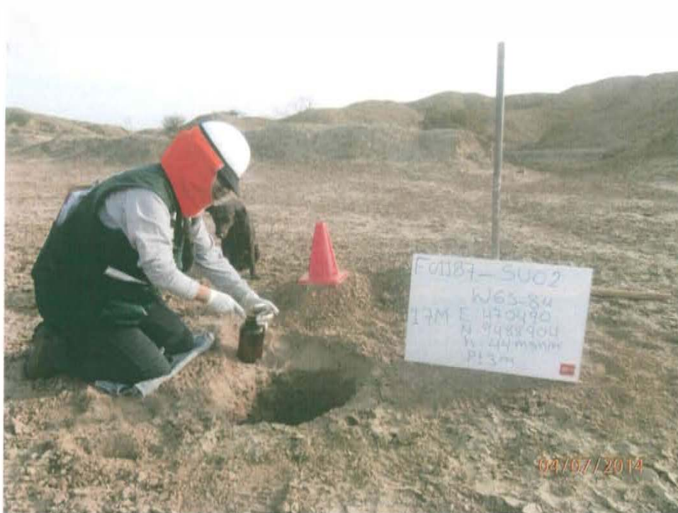
Fotografía N° 4. Toma de muestra de suelo en el punto F01187-SU02, ubicado a 25 m aproximadamente del Pozo T3758.