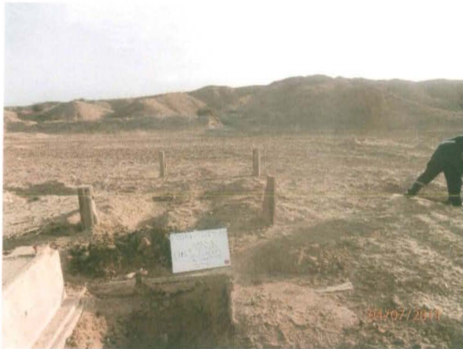
Fotografía N° 2. Vista panorámica del pozo inactivo ubicado en colinas bajas con relieve ondulado.