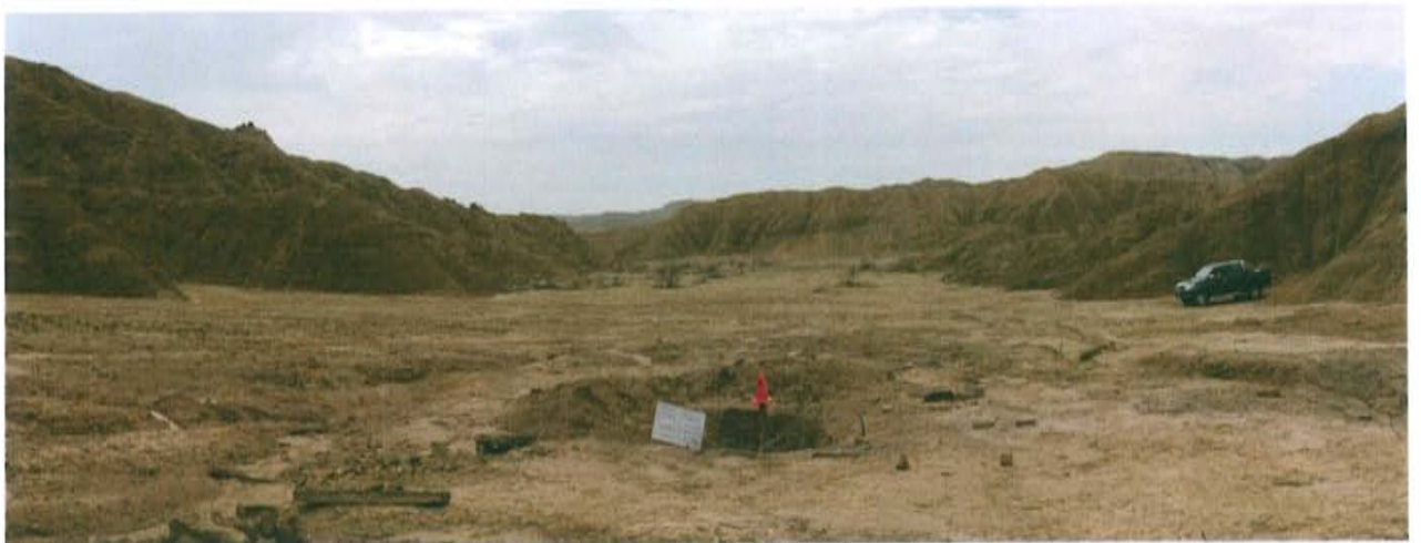
Fotografía N° 2. Vista panorámica del área circundante al pozo inactivo T3663.