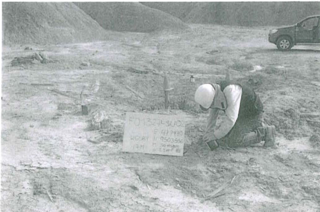
Fotografía N° 2. Toma de muestra de suelo en el punto F01327-SU02, ubicado a 3,2 m aproximadamente al noreste del Pozo T3663.