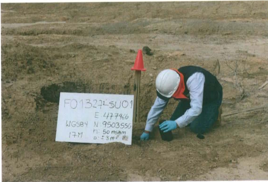
Fotografía N° 3. Toma de muestra de suelo en el punto F01327-SU01, ubicado a 2 m aproximadamente al oeste del Pozo T3663.

"Año de la Promoción de la Industria Responsable y del Compromiso Climático" "Decenio de las Personas con Discapacidad en el Perú"