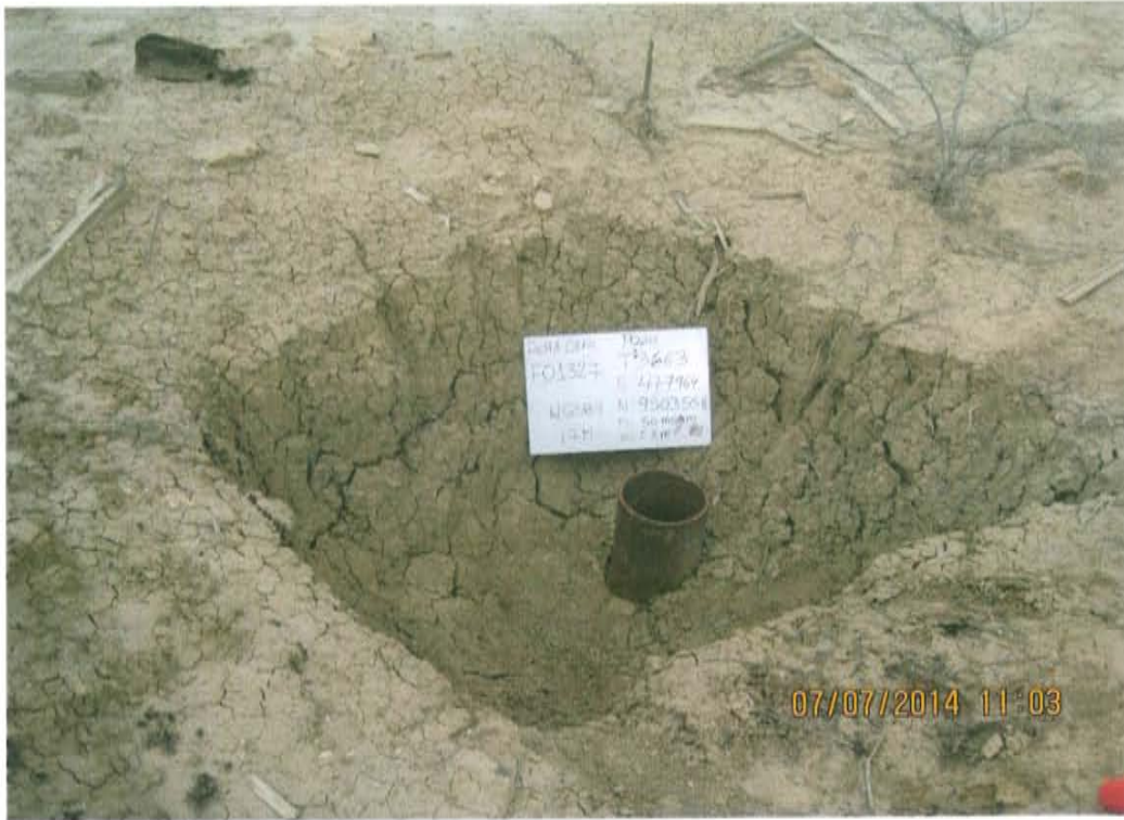
Fotografía N° 1. Identificación del pozo inactivo con código PERUPETRO T3663. Presenta casing corroído y abierto, descubierto sobre fondo de excavación.

"Año de la Promoción de la Industria Responsable y del Compromiso Climático" "Decenio de las Personas con Discapacidad en el Perú"