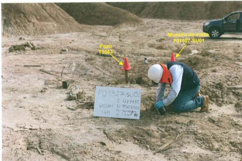
Fotografía N° 4. Toma de muestra de suelo en el punto F01327-SU02, ubicado a 3,2 m aproximadamente al noreste del Pozo T3663.