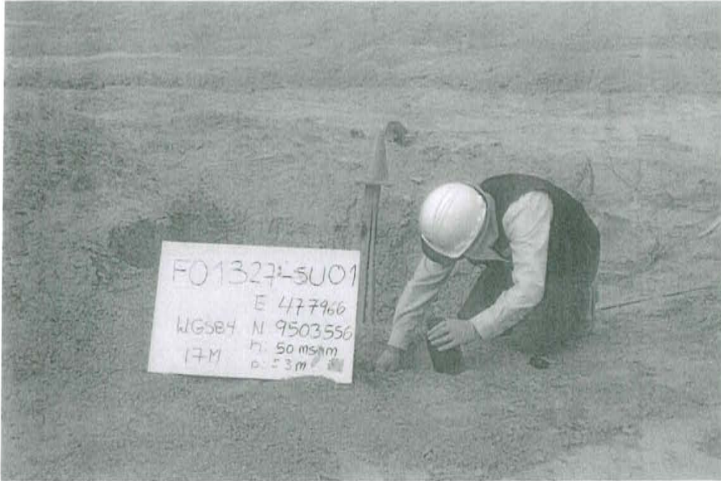
Fotografía N° 1. Toma de muestra de suelo en el punto F01327-SU01, ubicado a 2 m aproximadamente al oeste del Pozo T3663.

"Decenio de las Personas con Discapacidad en el Perú" "Año de la Promoción de la Industria Responsable y del Compromiso Climático"