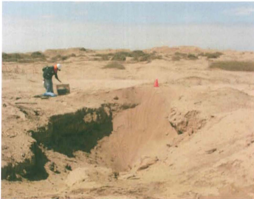
Fotografía N° 1. Ubicación del pozo inactivo ubicado en una excavación, con casing expuesto al ambiente.

"Año de la Promoción de la Industria Responsable y del Compromiso Climático" "Decenio de las Personas con Discapacidad en el Perú"