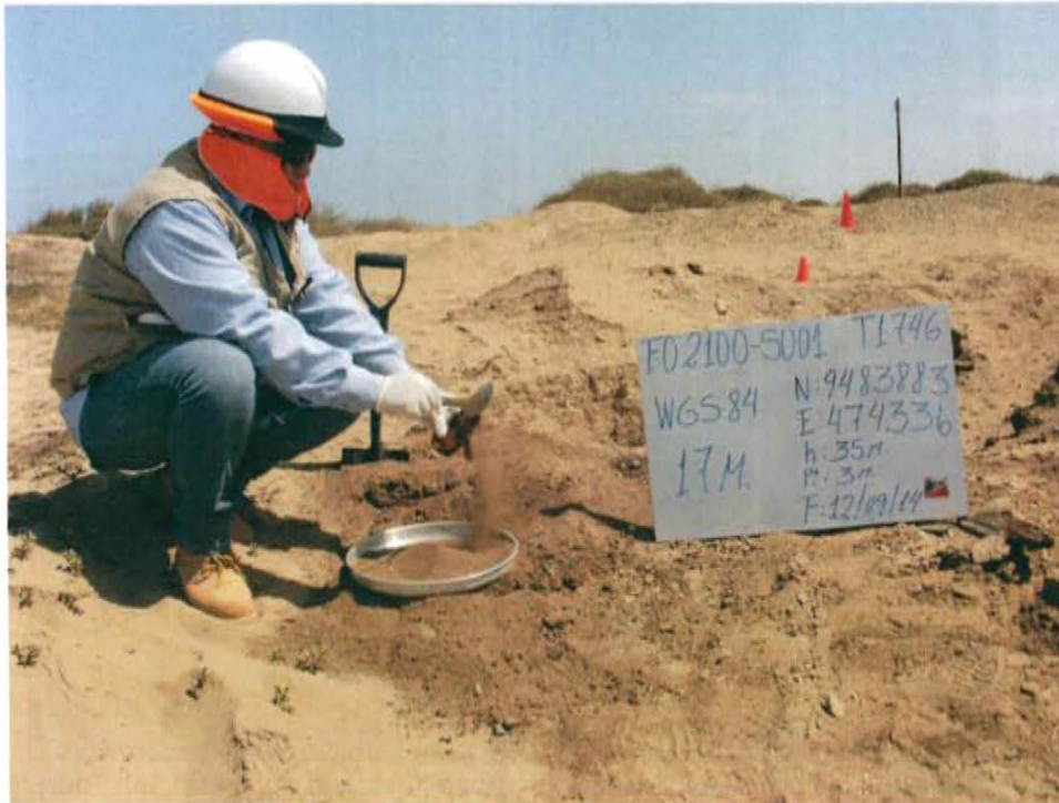
Fotografía N° 3. Toma de muestra de suelo en el punto F02100-SU01, ubicado a 2 m aproximadamente del Pozo T1746.

"Año de la Promoción de la Industria Responsable y del Compromiso Climático" "Decenio de las Personas con Discapacidad en el Perú"