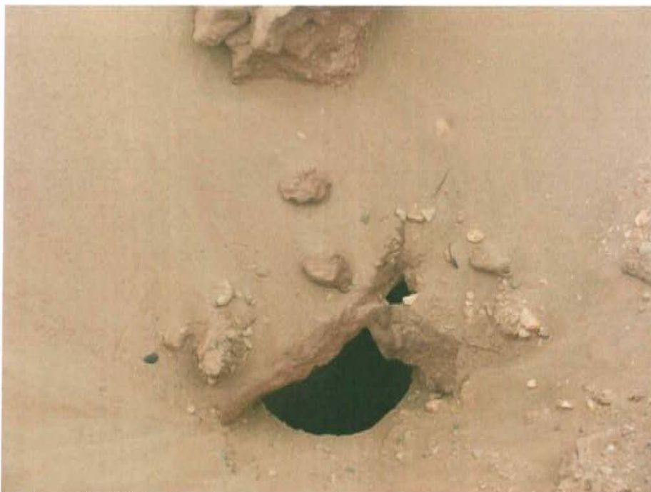
Fotografía N° 2. Se observa que el pozo presenta casing el cual se encuentra abierto, sin elemento de cierre tales como válvulas, llaves entre otros, que garanticen un cierre hermético del pozo. Se aprecia en la partes superior del casing (boca de pozo) materiales de los alrededores de la excavación probablemente producto del deslizamiento de las paredes laterales de la misma .