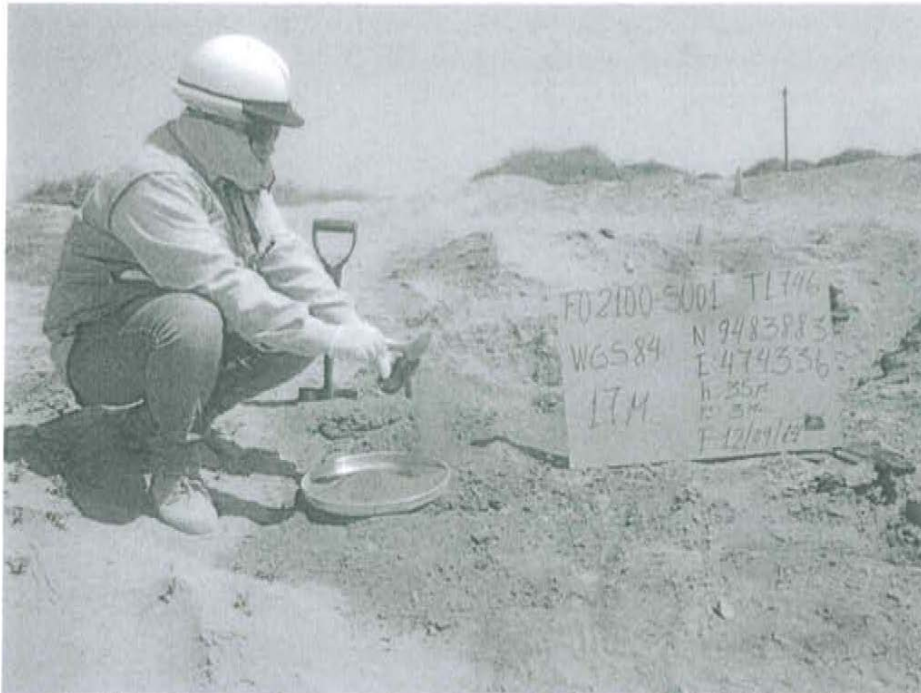
Fotografía N° 1. Toma de muestra de suelo en el punto F02100-SUO1, ubicado a 2 m aproximadamente del Pozo T1746.

"Decenio de las Personas con Discapacidad en el Perú" "Año de la Promoción de la Industria Responsable y del Compromiso Climático"