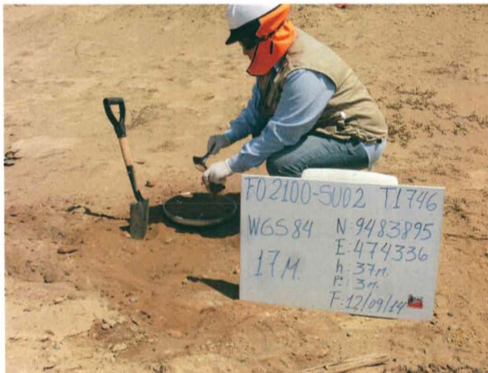
Fotografía N° 4. Toma de muestra de suelo en el punto F02100-SU02, ubicado a 6 m aproximadamente del Pozo T1746.