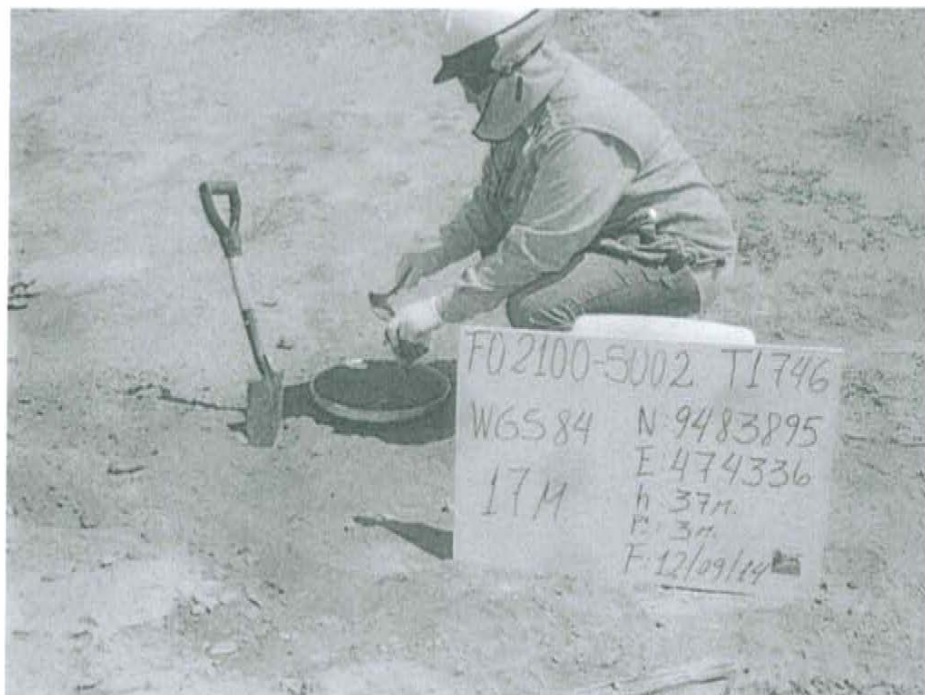
Fotografía N° 2. Toma de muestra de suelo en el punto F02100-SUO2, ubicado a 6 m aproximadamente del Pozo T1746.