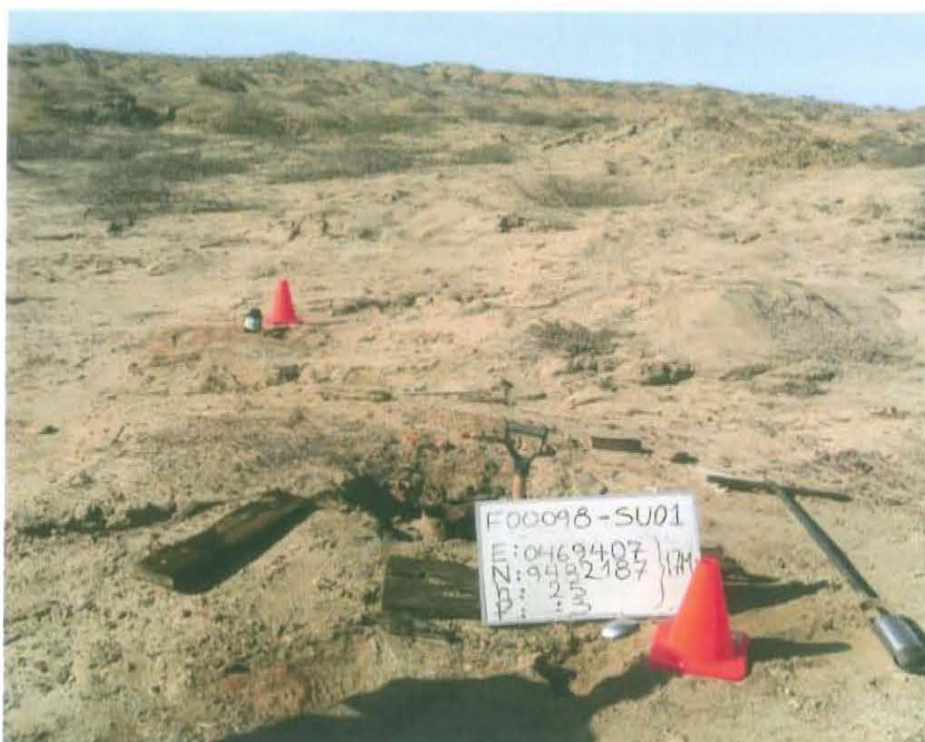
Fotografía N° 3. Toma de muestra de suelo en el punto F00098-SU01, ubicado a 1 m de distancia del casing del Pozo T599.

"Año de la Promoción de la Industria Responsable y del Compromiso Climático" "Decenio de las Personas con Discapacidad en el Perú"