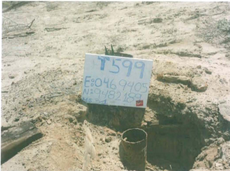
Fotografía N° 1. Pozo inactivo mal abandonado de la Ficha OEFA F00098, con acumulación de arena en su interior.

"Año de la Promoción de la Industria Responsable y del Compromiso Climático" "Decenio de las Personas con Discapacidad en el Perú"