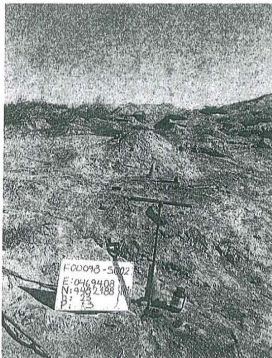
Fotografía N° 2. Toma de muestra de suelo en el punto F00098-SU02, ubicado a 14 m aproximadamente del Pozo T_599.