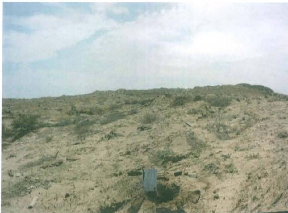
Fotografía N° 2. Vista panorámica de la zona circundante del Pozo T599 de la (Ficha OEFA F00098), presenta zona de extensas superficies bajas plano-depresionadas con pequeñas elevaciones.