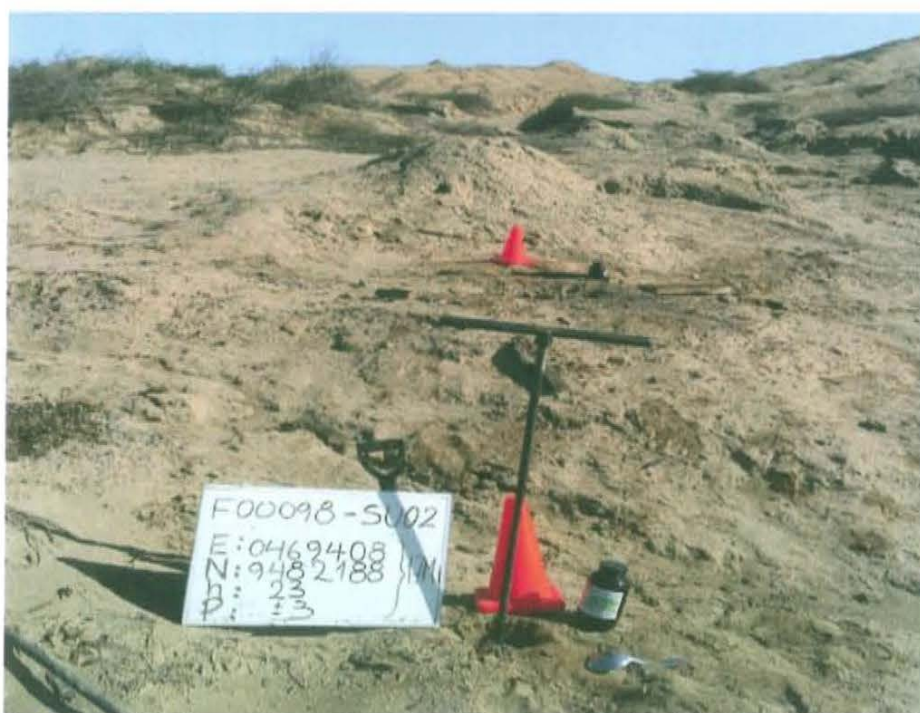
Fotografía N° 4. Toma de muestra de suelo en el punto F00098-SU02, ubicado a 14 m de distancia del casing del Pozo T599.